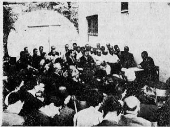
Z lanskega zborovanja v Dragi