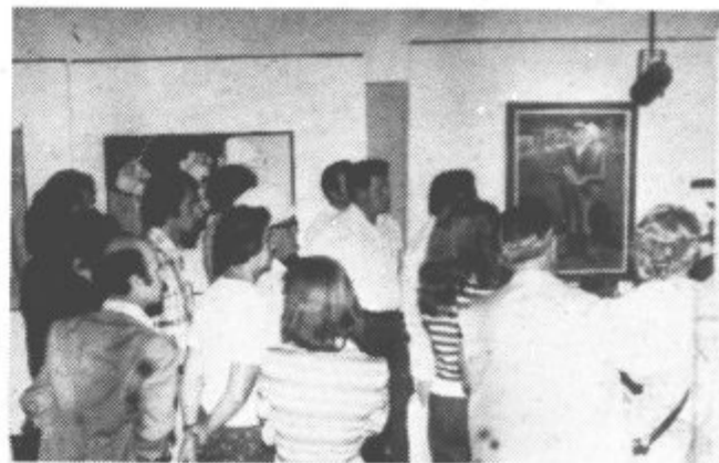
Z otvoritve razstave v Velenju