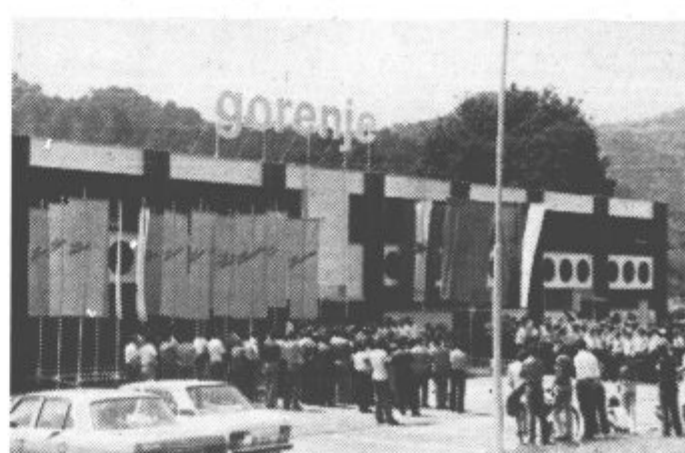
Novo proizvodno poslopje v Rogatcu