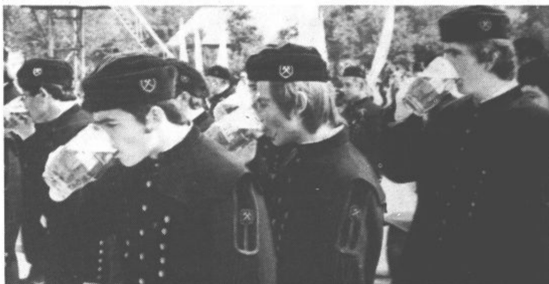
S skokom čez kožo in pivoin, ki so ga spili na dušek, so absolventi poklicne rudarske šole v Velenju potrdili, da so pripravljene za naporno delo v jami

Po slovesni podelitvi izkaznic je novosprejetim komunistom spregovoril tudi Franc Leskošek—Luka