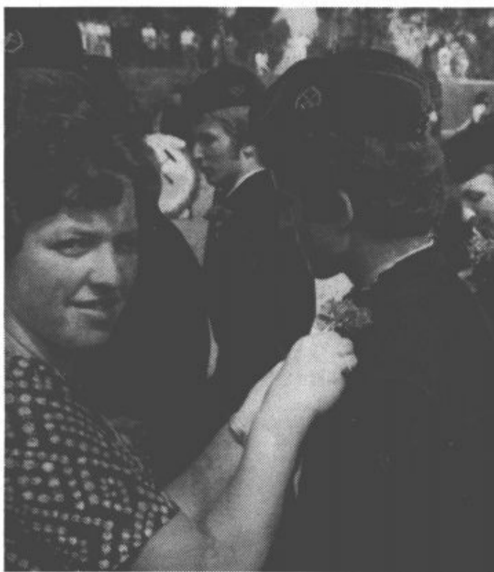
Pred svečano ceremonijo so dekleta pripela mladim rudarjem na psi nageljne

Obudil je spomin na veliko revolucionarno zgodovino delavskega gibanja in vlogo slovenskih rudarjev v njem in poudaril, da so bili rudarji vedno tisti, ki so najbolj visoko dvigali borbeno zastavo delavskega gibanja in so vedno v prvih vrstah stopali v boj za