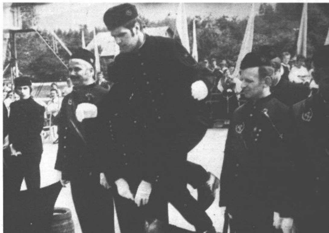
Skočil je čez napeto kožo in postal rudar

Fanfara so zatem označile začetek najlepšega trenutka za mlade rudarje — skoka čez kožo. 46 rudarjev v rudarskih svečanih oblačilih je stopilo na sodčke piva in skočilo čez kožo, ki so jo držali rudarske starešine. Mladi rudarji so nato obljubili, da bodo ostali zvesti rudarskemu poklicu in se nato pomešali med starejše rudarje na tribuni, ki so jih s krepkim stiskom roke sprejeli medse. Preostali del dneva pa so rudarji preživeli na pikniku na velenjskem gradu.