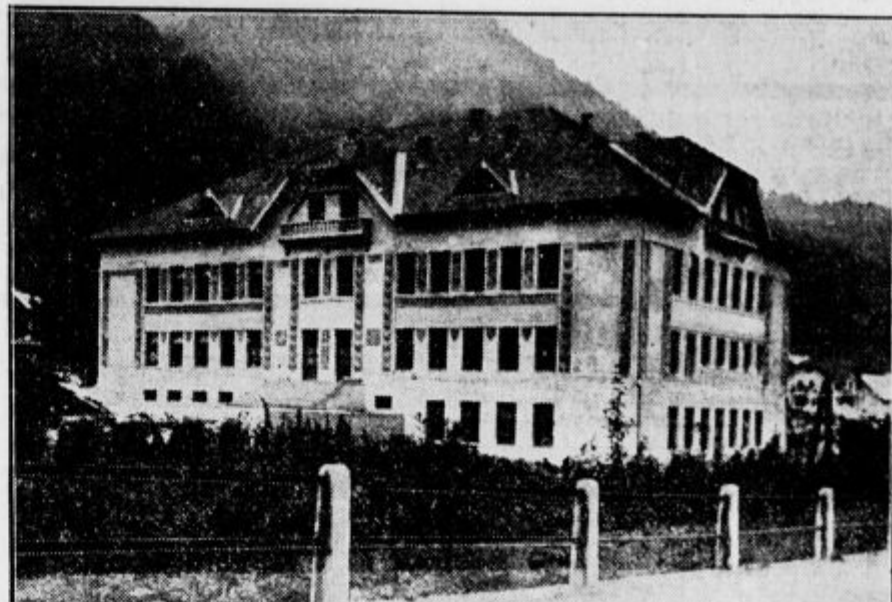
Krekov Prosvetni dom na Jesenicah