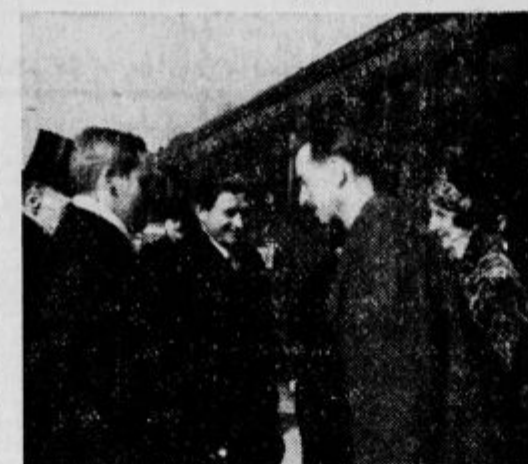
Francoski poslanik in njegova gospa progosa se pozdravljata z zastopniki oblasti in organizacij.

Ob 11 je francoski poslanik v spremstvu francoskega konzula obiskal mestnega župana dr.