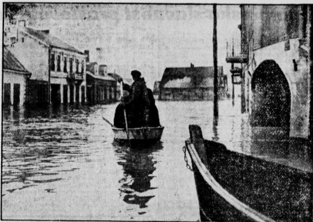
Povodnji v Kovnu, litovskem glavnem mestu so povzročile veliko škodo. Nekateri deli mesta in tovarne stoje do 2 in pol metra v vodi. Voda je narasla za 7 metrov, kar se že 30 let ni zgodilo.

»Prosim, gospod, tukaj je vaša črna kava, naravnost iz Brazilije smo jo dobili.« »Saj zato — tam ste torej bili toliko časa.«