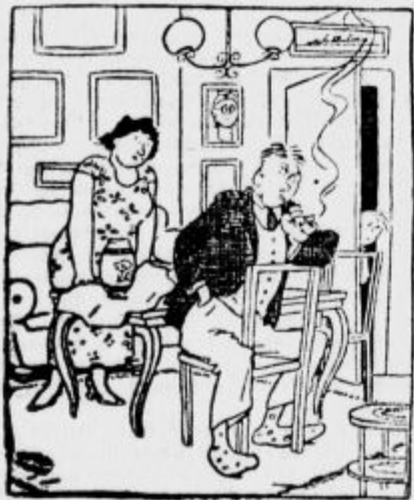
Ona: »Torej vedi, če ne dobim novega klobuka, da ves teden ne zinem besedicel!« On: »Ali se lahko na to zanesem?«

»Prosim, gospod Črninik, kar lahko! Če ne boste porabili preveč elektrike in me ne boste ponoči v spanju motili, svojim najemnikom dovoljujem, da smeo porabljati vse moderne aparate.«