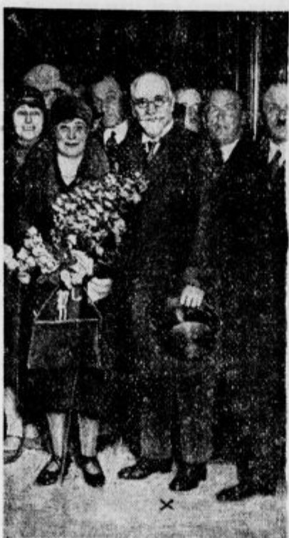
Pokojni Venizelos z ženo

Življenje, ki je bilo posvečeno svobodi Grčije, vsega Balkana in slogi njega narodov