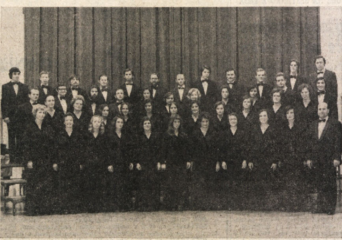
Pevski zbor «Consortium musicum»