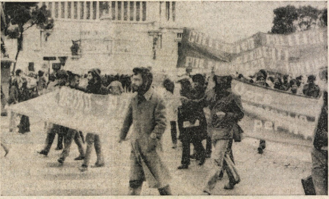
Na Trgu Minerva v Rimu se je večeraj na protestni manifestaciji proti Pedinijevemu zakonskemu odloku zbralo nad 2 tisoč univerzitetnih delavcev. Zborovanje so sklicali zvezi sindikati CGIL, CISL in UIL, katerih predstavniki so tudi spreverili zbranimu učnemu in neučnemu osebju italijanskih vseučilišč