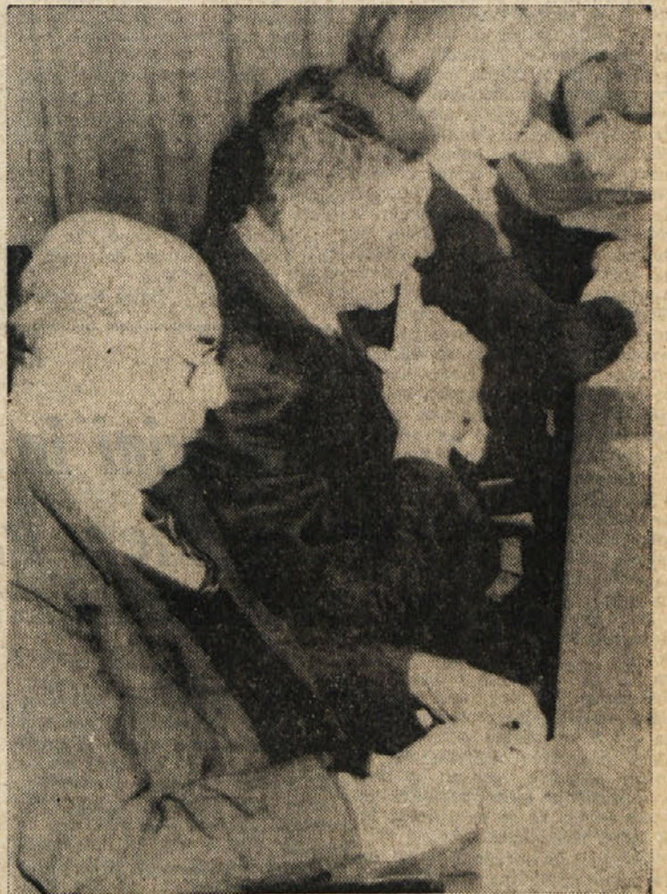
Z večerajšnjega zasedanja centralnega komiteja KPI: spredaj Giorgio Amendola, za njim Giorgio Amendola, ki je imel v ponedeljek uvodno poročilo o evropskih vprašanjih, pa tudi o političnem položaju v Italiji, zadaj pa Nilde Iotti

Pred Barca je vodja gospodarske sekcije PSI Fabrizio Cicchitto uporabil še bolj ostre izraze. Po njegovi besedi mučilo na prijateljskem in delovnem obisku in imel pogovore z vodilnimi predstavniki poljske združene delavske partije.