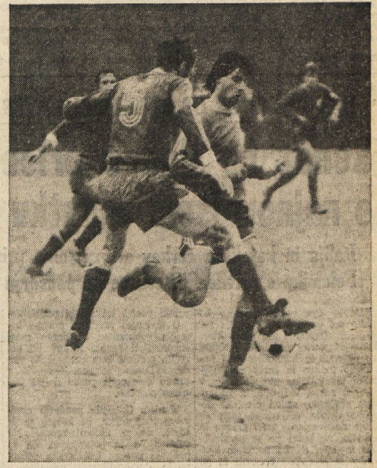
Gaja je v 2. amaterski nogometni ligi Campanellam odvzela točko