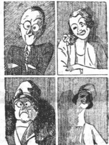
Te štiri fotografije se vam gotovo ne zde imenitne. Pa so vendarle, saj so dobile prve nagrade na razstavi najslabših fotografij.