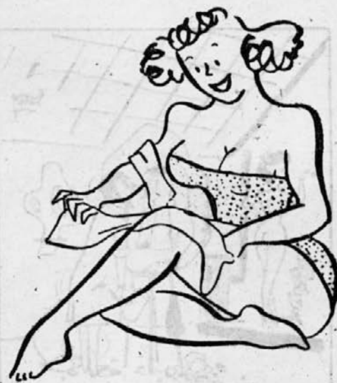
Riba vsaka ni sardina, ki na nylon se lovi.