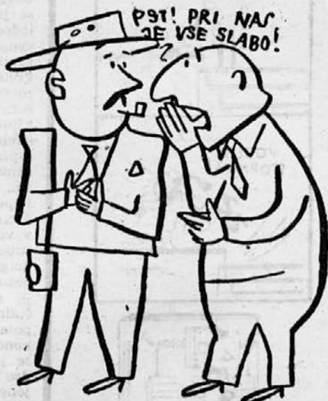
Ni zabaven vsak možakar, ki bi rad bil humorist.