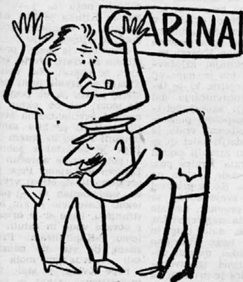
Ni zdravnik vsak strokovnjakar, ki pretipa ti obist.