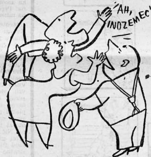
Ni vsak ober al' natakar, ki se klanja ti do tal.