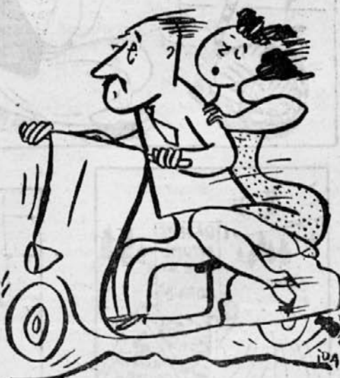
Treba ni, da za bolezen morsko k morju se podaš, in da kot »Sidol« — ljubezen pred porabo premečkaš.