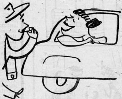
Ni šofer, kdor v limuzini za »vsakdanji kruh« skrbi.