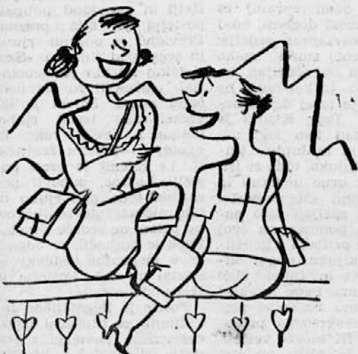
Zverinjak ni kraj edini, kjer se »afen« trop podi.