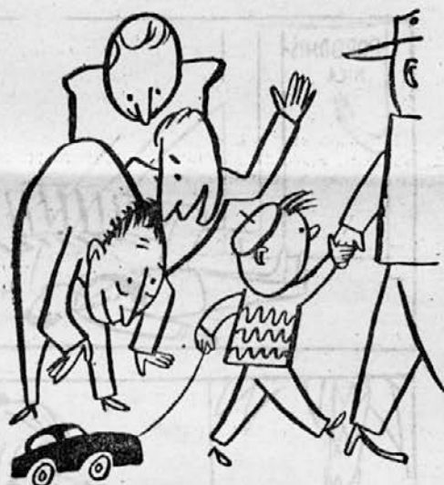
Ni mehanik vsak možakar, ki tvoj avto bo zijal.