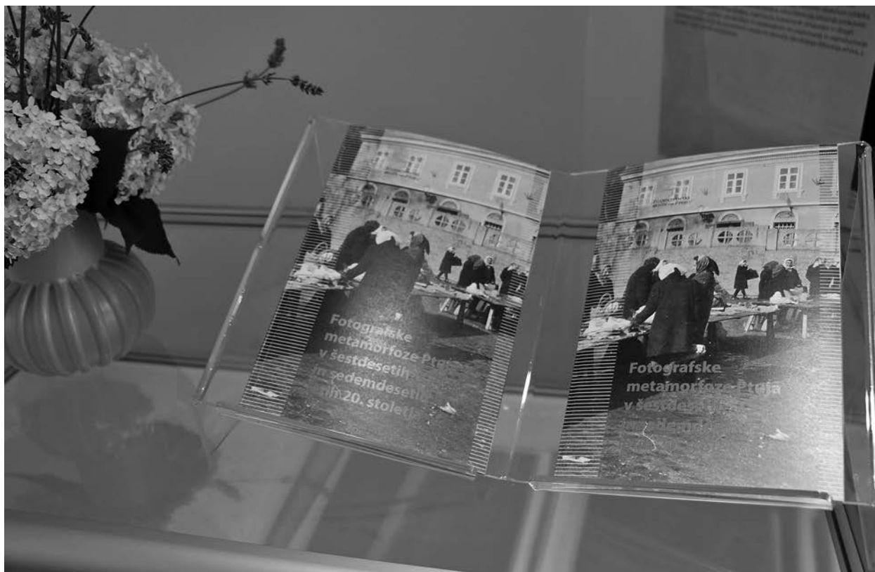
Z otvoritve razstave, 20. junij 2019, galerijski hodnik ZAP, Zgodovinski arhiv na Ptuj