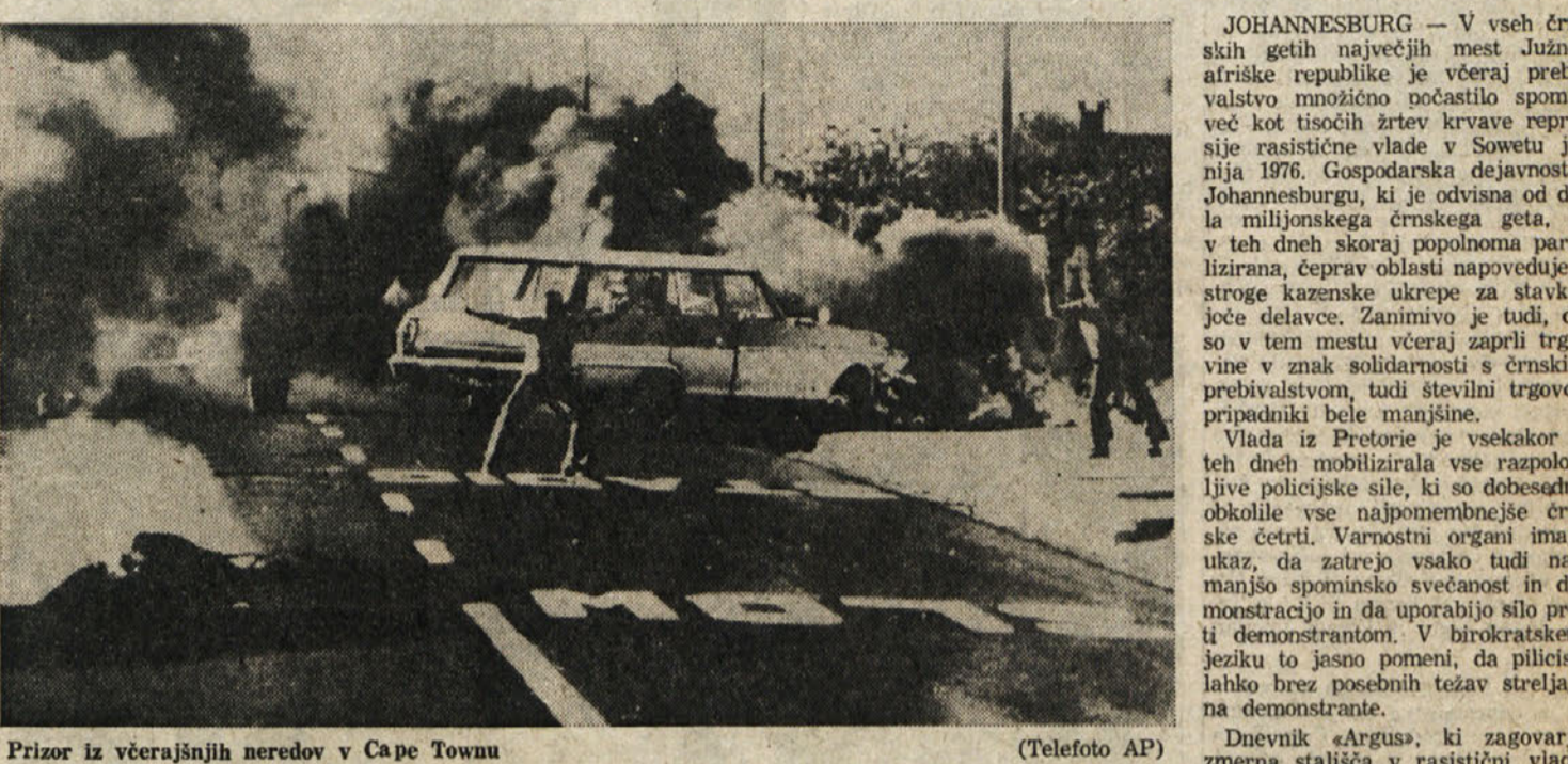
Prizor iz večerajšnjih neredov v Cape Townu

Po uradnih podatkih naj bi v neredih umrlo nad trideset oseb - Stavke črnega prebivalstva hromijo gospodarstvo rasističnega režima