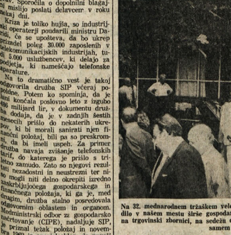
Na 32. mednarodnem tržaskem velesejmu se je včeraj odvijal dan Jugoslavije. Ob tej priliki se je mudilo v našem mestu širše gospodarsko odposlanstvo iz Slovenije in Hrvaške, ki je imelo vrsto razgovorov na trgovinski zbornici, na sedežu deželnega odbora Furlanije - Julijske krajine in z gospodarstveniki na samem sejmu. Poročila objavljamo na drugi strani