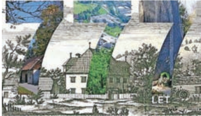
Ilustracija Dušana Sterleta ob 777. obletnici prve omembe Perovega

Tradicionalno Perovanje bo 5. maja od 15. do 19. ure na Perovem.