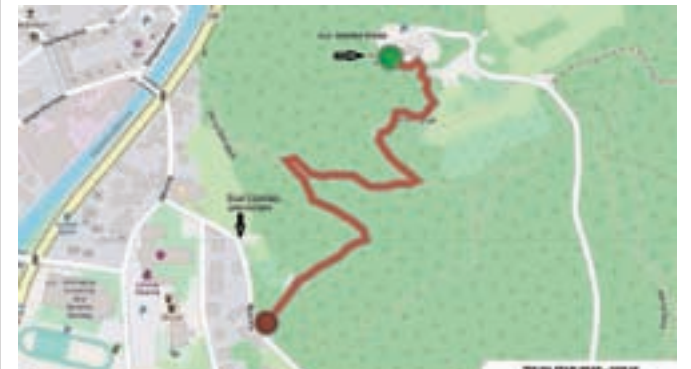
Trasa teka za osnovnošolce