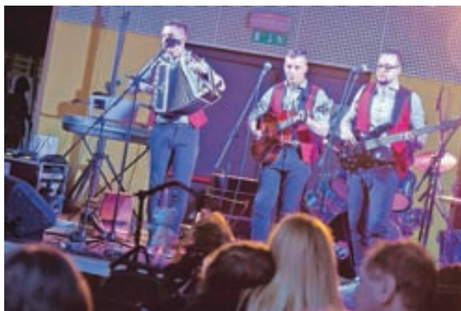
Izkupiček koncerta je ob dobri udeležbi obiskovalcev znašal slabih osemsto evrov.