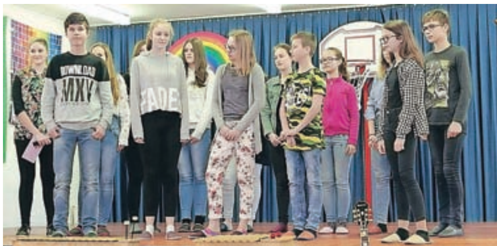
Mladinski pevski zbor

Vsak izmed petih tekmovalcev je namreč vsaj v enem od štirih skokov prejel zelo visoko sodniško oceno 9,7 ali celo 9,8. To pomeni, da je izvedel skok, ki je bil visok, tehnično in estetsko dovršen ter ga je skakalec tudi zaključil z zanesljivim doskokom.