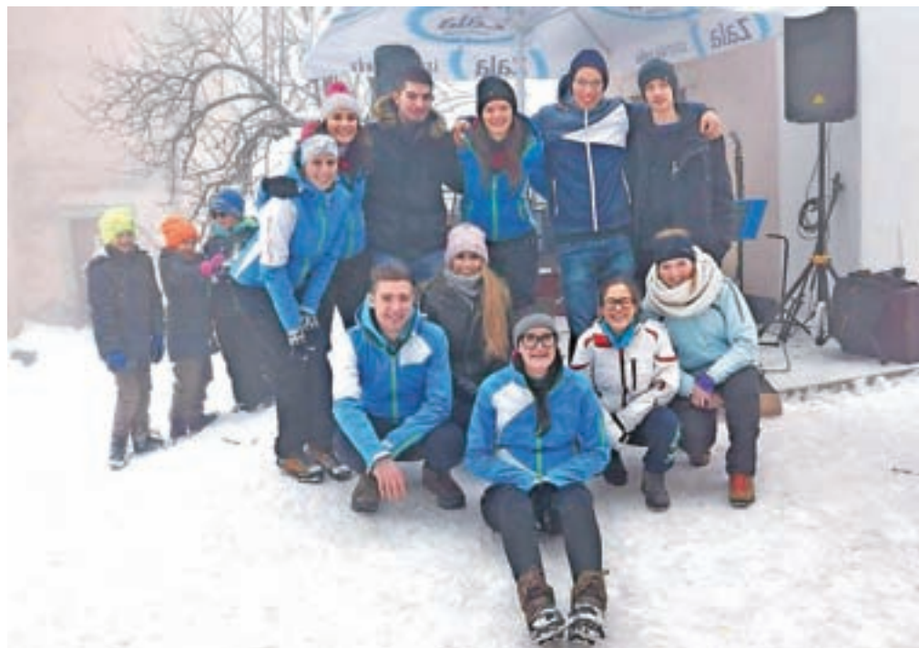
Člani Študentskega kluba Kamnik so samo s Pohodi na Sv. Primoža zbrali več kot 1700 evrov.