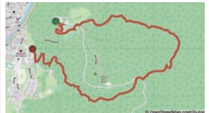
Trasa teka za odrasle