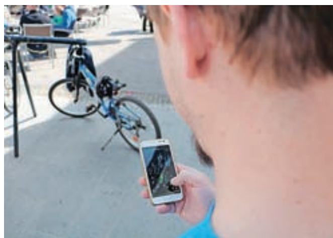
Udeleženci dogodka so lepote Kamnika odkrivali preko pametnih telefonov.

Kamnik je nedavno gostil več kot 150 ljubiteljev igre Ingress iz dvanajstih držav, ki so kamniške znamenitosti spoznavali skozi misije v mobilni aplikaciji.