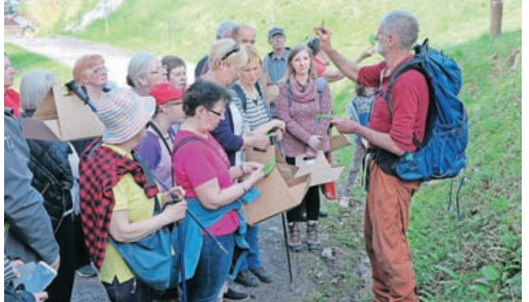
Spoznavanje samoniknih rastlin in nabiranje čemaža v okolici term

»Z izvedbo prvega Festivala čemaža smo lahko več kot zadovoljni, zagotovo pa bo več ljudi prihodnje leto, ko bo dogodek še bolj prepoznan. Za nas je najpomembnejše, da čemaž – darilo narave, ki raste v okolici naših term – predstavimo in vključimo v naše dogajanje in ga poneseemo v širšo uporabo,« je bil v soboto zadovoljen