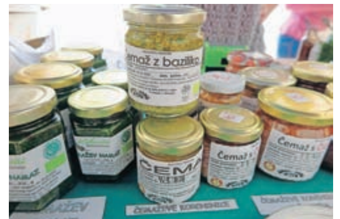
Čemaž postaja vse bolj priljubljen v kulinariki, a previdnost pri nabiranju ne bo odveč!