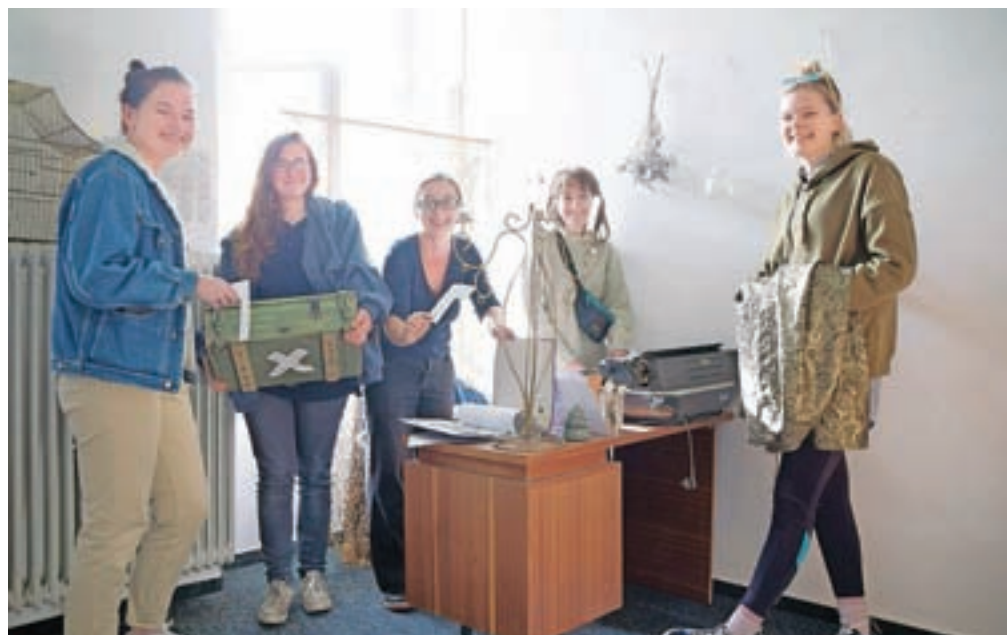
Ustvarjalke sobe pobega v Katzenbergu