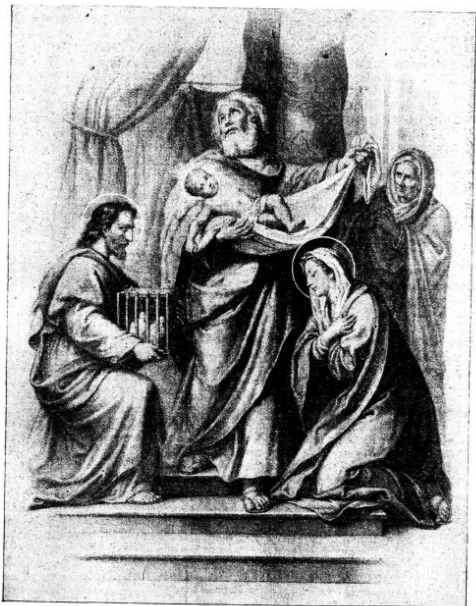
Luč v razsvetljenje nevernikov.

ni nobenega domačega berača. Vsi reveži so tako oskrbljeni, da jim beračiti ni treba, zdravnik jih pa zastonj zdravi. — To je nekako vzor domače dobrodelnosti, če se more toliko doseči, da se beračenje odpravi.