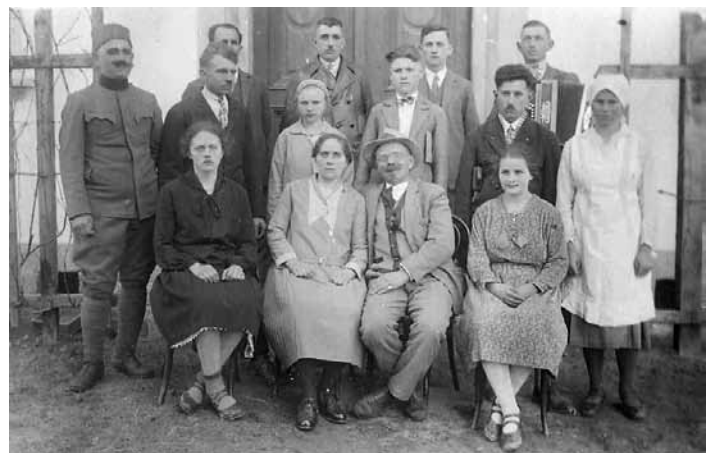
Igra Poslednji mož, 28. marec 1932.