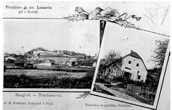
Pozdrav iz Sv. Lenarta. Razglednica iz konca 19. stol.

jarka in zunanjega okopa, ki spominjajo na predzgodovinsko ali zgodnjeresrednjeveško selišče.