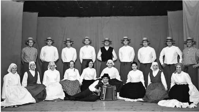
Folklorna skupina Podgorci, 2009. leta.

V letu 2008 je folklorna skupina začela nabavljati material in seveda tudi zbirati finančna sredstva za delovne noše. Z novimi nošami so se predstavili na zdaj že tradicionalni prireditvi »Podgorci pojejo in plešejo 2009«, ki so jo v letu 2009 organizirali že petič