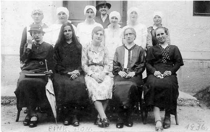
Igra Prisega, odigrana na binškotni ponedeljek 1936. leta.

zapečatili v tri tristolitrne sode in jih zakopali v zemljo. Nekaj knjig pa so v zabojih prenesli na podstrežje okupatorjevega občinskega urada: to so bile v glavnem šolske uradne knjige in spisi. Vseh knjig niso uspeli rešiti, saj jih je vojaštvo in nemško učiteljstvo vrglo iz šole na travnik, kjer so jih skupaj z dramskim odrom sežgali. Ostale so le kulise, pa še te so bile močno poškodovane.