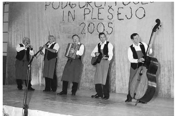
Nastop ljudskih godcev na prireditvi Podgorci pojejo in plešejo, 2005. leta.

Godli so na vse. Na ljudske instrumente, ki smo jih že pozabili, na improvizirana ropotala, ki so poudarjala ritem v glasbi, na prava glasbila, ki so jih izdelali mojstri.