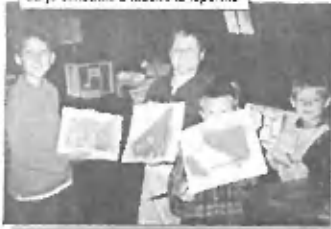
Šli je v nastanku z izdelki iz lepence

Ustvarjalne duše so letos ustvarjale iz lepence in naravnih materialov, izdelovale rože in šopke iz papirja, zapletale so se pri pletenju zapestnic, vozale pri makrameju, se gubale pri origamiju in pripravile kakšen tolar z razglednicami, ki so jih ustvarile same. Tisti, ki jim jezik dobro teče, so se lotili tudi japonsčine in francoščine, mojstri peresa so se poskusili v novinarstvu, dolgooprsti pa so brenkali na kitaro.