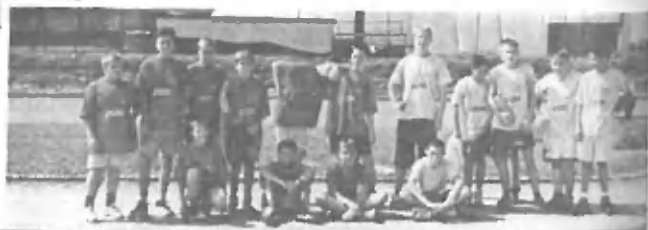
OŠ TAZIN : OŠ MENGEŠ

REZULI TATI TEKEM : s pričetkom ob 12.00 uri in uradnim zaključkom ob 19.00 uri