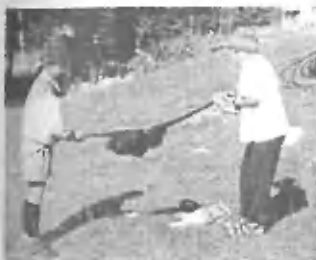
Umazano delo po taboru, pa je ostalo samo za izbrance.

Bivakiranje nam je letos dobesedno zmrznilo. Prezebanje v spalni je sicer čar bivakiranja, a smo se s tem dovolj ukvarjali že v šotorih, tako da smo se dodatnemu zmrzovanju kar mime duše odpovedali.