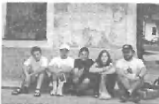
Pred "legendarno" trgovino v vasi Na Logu v Trenti

zasukali rokave in s polno paro pripravljamo novo številko Ogrčkov. In ne pozabite: OGRČKI so v planinski javnosti ocenjeni kot NAJBOLJŠI DRUŠTVENI ČASOPIS V SLOVENIJI .