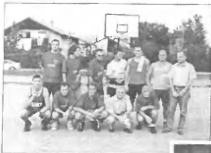
DREAM TEAM TRZIN

drsečemu aslatlu in nezaključnemu delu igrišča.