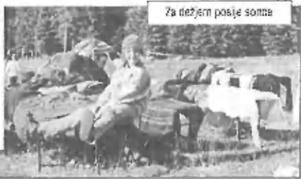
Za dežjem posije sonce

Četrtek naliv je popolnoma onesposobil dva šotora. Pregnanci so prenočevali v avtu, skladišču in eden celo - oh, kakšen srečnež - med dekletji. Na srečo nam je petek namenil dovolj sonca, tako da smo za silo posušili poplavljeni imetje.