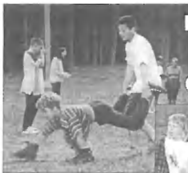
Igre brez meja

Za preganjanje dolgčasa smo organizirali nekaj tekem v odbojki in nogometu, karaoke, WICI kviz in še en kviz, igre brez meja, lov za zakladom in prepevanje ob tabornem ognju - no, ja - ob plinskih svetilkah, če smo čisto poštenj.