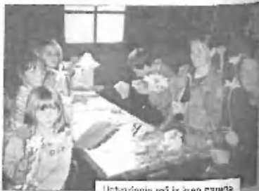
Ustvarjanje rož iz lepence

Ustvarjalne duše so letos ustvarjale iz lepence in naravnih materialov, izdelovale rože in šopke iz papirja, zapletale so se pri pletenju zapestnic, vozale pri makrameju, se gubale pri origamiju in pripravile kakšen tolar z razglednicami, ki so jih ustvarile same. Tisti, ki jim jezik dobro teče, so se lotili tudi japonsčine in francoščine, mojstri peresa so se poskusili v novinarstvu, dolgooprsti pa so brenkali na kitaro.