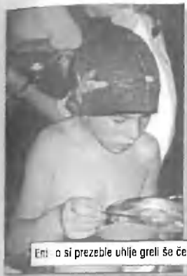
Eni o si prezeble uhiše greli še čez dan.

Prostor za izobraževalne dejavnosti so nam prijazno posodili kar v vojašnici.