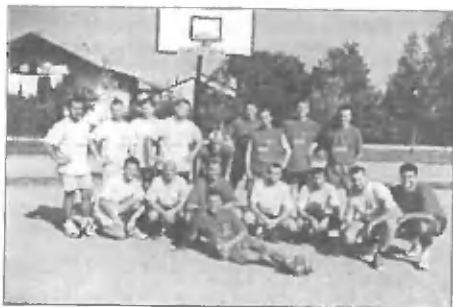
Aljoševi PRIJATELJI : Aljoševi SOŠOLCI

Tekme so bile zelo zanimive, saj so se vsi igralci borili z mislimi na poštenem druženju. Razveseljiv je tudi podatek, da se tokrat ni zgodila nobena poškodba kljub