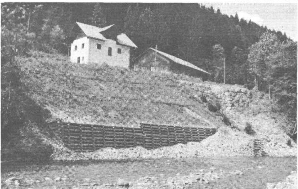
Tudi v hudourništvu uporabljajo v zadnjem času pristope in materiale, ki so bolj prijazni okolju. Tako so n.pr. pri Prušnikovi domačiji nad Savinjo uporabili za varovanje brega pred deročo vodo leseno kašto, za zaščito brežine pred površinskim delovanjem vode zatravitev in vrbov poplet, strugo hudourniškega Pršnikovega grabna pa so utrdili s kamnito pregrado iz avtohtonega kamenja.