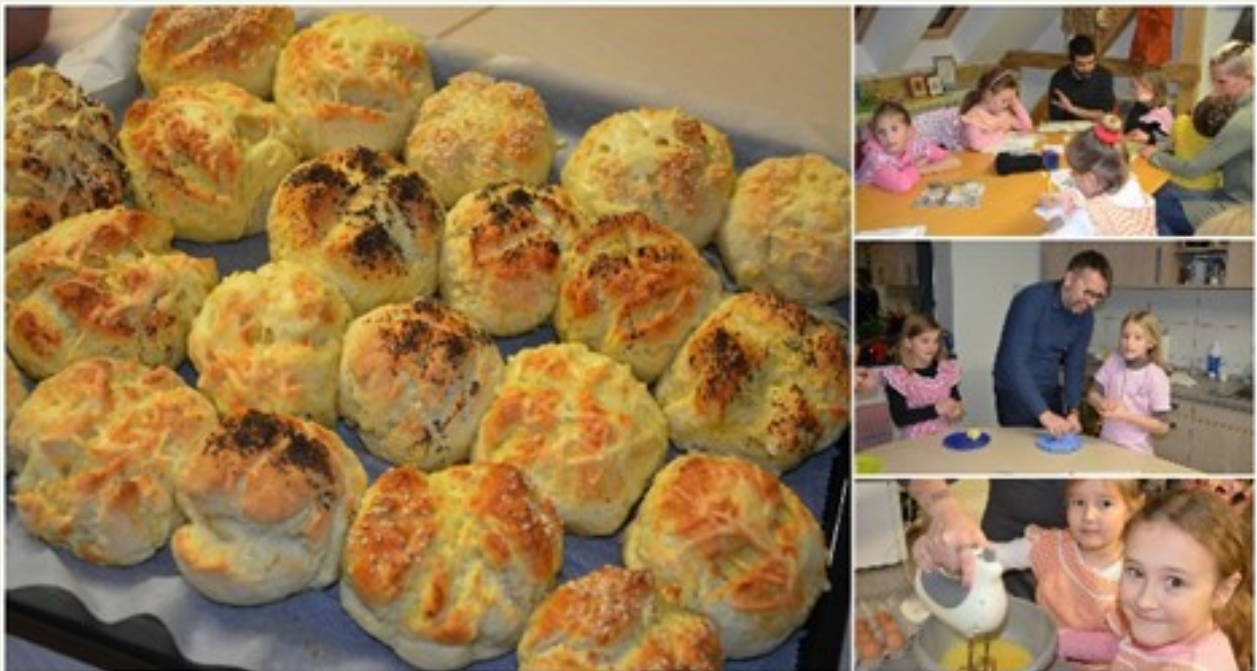
Pekarna Miš Maš