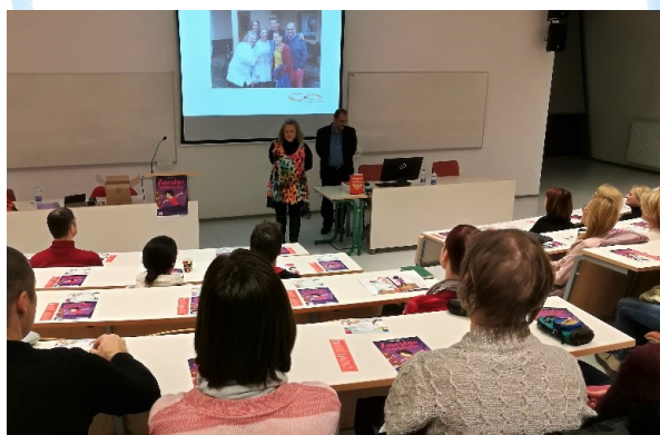
Predavanje v Novem mestu

V Novem mestu smo 10. 1. 2019 gostovali v dvorani Šolskega centra Novo mesto. Udeležba je bila manjša od pričakovane, kljub temu pa so prisotni ob koncu predavanja izrazili zadovoljstvo nad slišanim, saj bodo nekatere spremembe lahko vnesli v svoje vzorce vzgoje otrok.