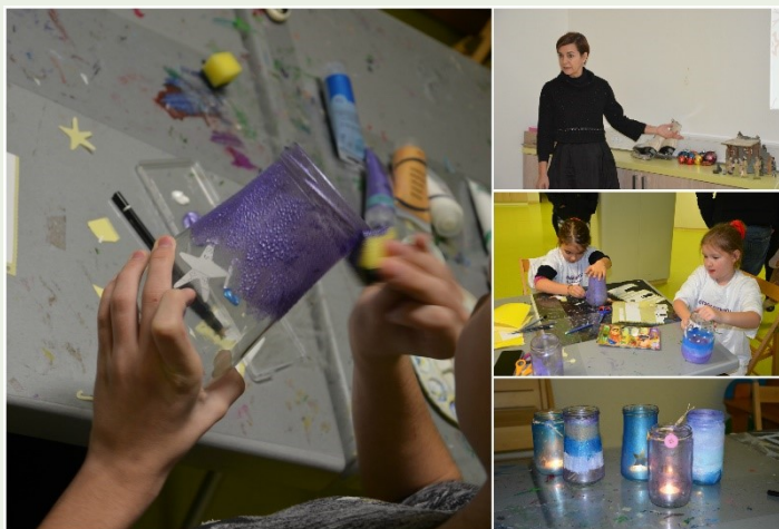
Muzej na obisku (običaji in prazniki)