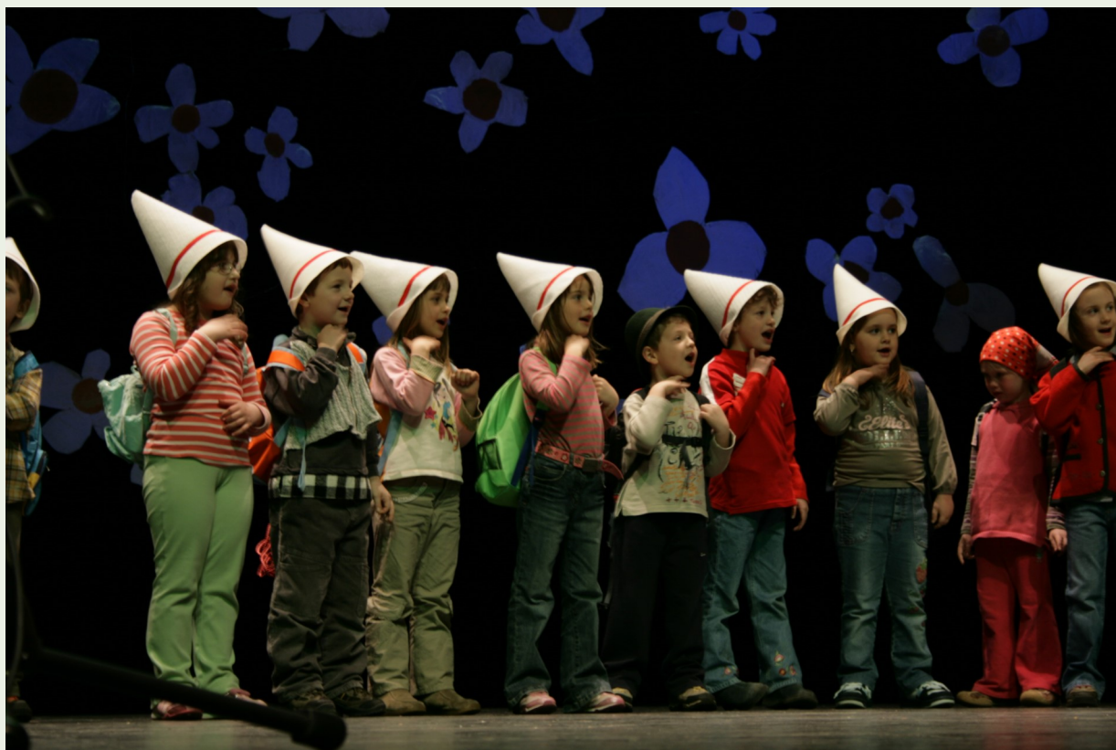
Nastop predšolskih otrok, predstavitev predšolskega letovanja, arhiv društva