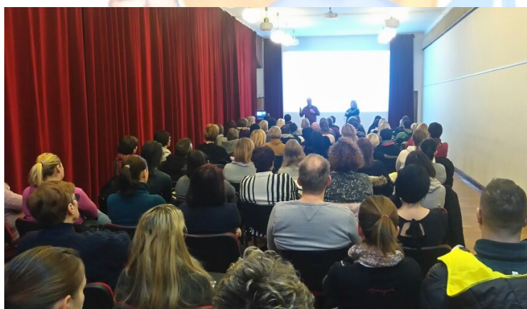
Predavanje v Trbovljah

Konec januarja, 31. 1. 2019, pa smo gostovali v Delavskem domu Trbovlje. Udeležba je bila precejšnja, zadovoljstvo in navdušenje udeležencev pa prav takšno kot na drugih lokacijah, kjer so bila predavanja že izvedena. Hvala Društvu prijateljev mladine Trbovlje za pomoč in sodelovanje pri organizaciji predavanja.