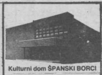
Kulturni dom ŠPANSKI BORCI

demskem učitelju, med drugim tudi odličnem kiparju prav male plastike Zdenku Kalinu. Zanimivo je vsekakor to, da se je 1980. leta diplomirana kiparka sprva dokaj igrivo spuščala v modeliranje raznih malih figuric in motivov, poleg otrok tudi raznih skupin, tako na razstavi prikazanega zamorskega benda. Kasneje je pričela upodabljati ženski lik, včasih akte polnih oblik, redneje pa postave mladih, dozorevajočih deklet v vsej njih