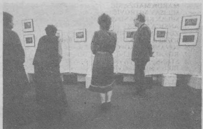
Razgrnjeni listi Pinterjeve mape