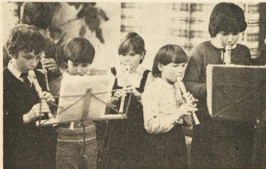
Bilčovs: Učenci glasbene šole napredujejo