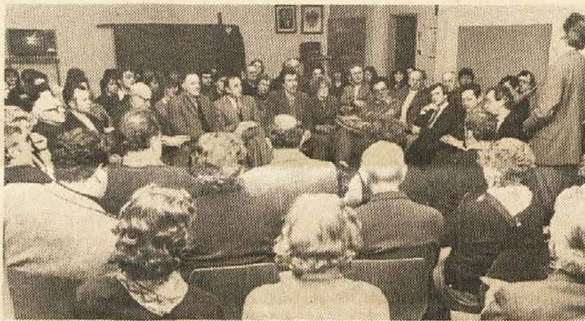
Bistrica v Rožu: Razprava o nasilnem izseljevanju in uporu Slovencev

gram s skupnim nastopom vseh harmonikašev in nato tudi z nastopom ansambla blokflavt ob spremljavi kitar. Navzoči štirje učitelji iz Slovenije so med drugim povedali, da obstaja seveda tudi možnost učiti se na drugih instrumentih. Isti dan so pri Adamu v Svečah prišli na svoj račun ljubitelji domačih jedi, ki so bile še pred nedavnim časom razširjene po vseh domovih rožanskih krajev in ki stopajo danes že precej v czadje. Ljubitelji majžlnov, sirovih in kvočnih krapov, godlje in kva-