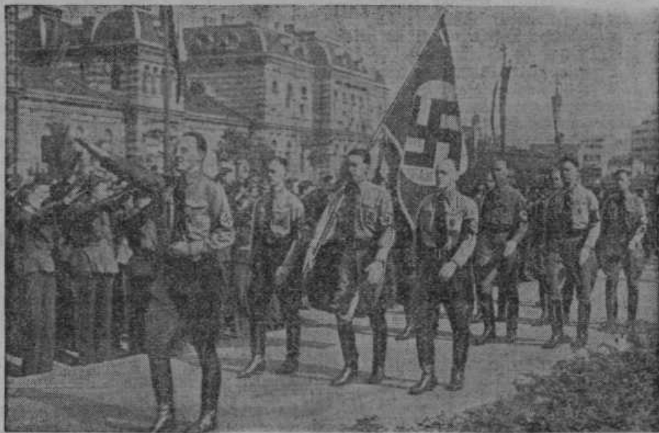
Romunska fašistična »železna garda« koraka po Bukarešti s kijkastimi križi