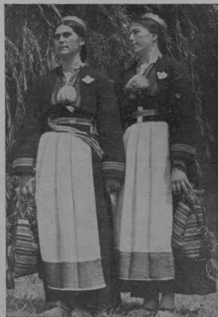
Pridvorje pri Dubrovniku