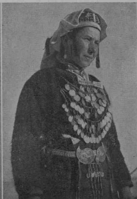
Zlosela, Zakonska žena s pokrivalom »počelice«