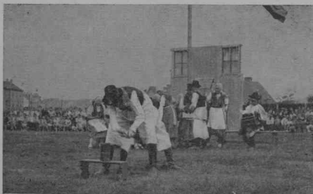
Šterjak: igra »Valek«