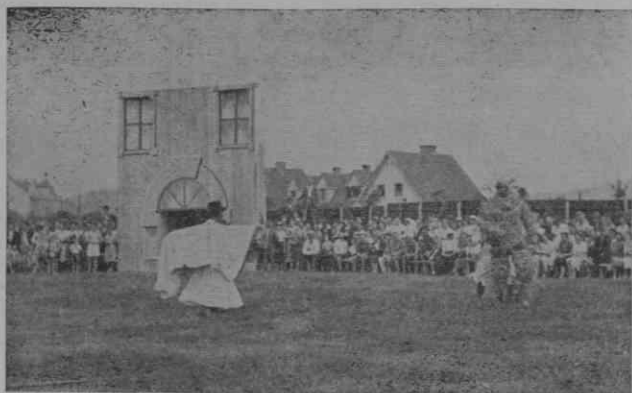
Rüsa in Rabolt