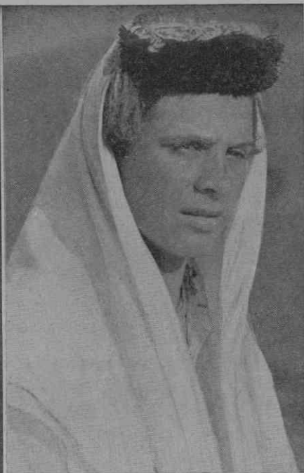
Golubčë (Bosna). Dekle s kapo »Kitalije«