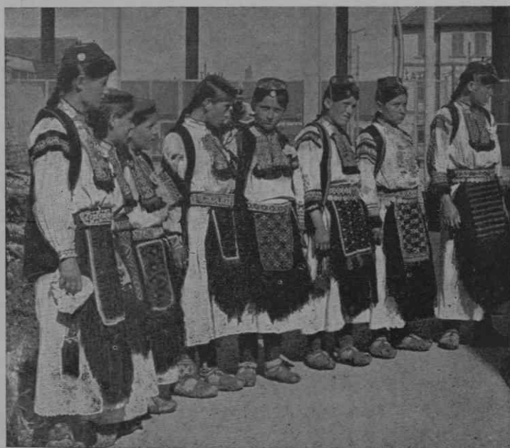
Rekavica pri Banja Luki