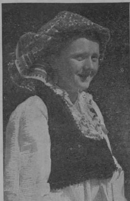
Čajdraš (Bosna). Dekle s pokrivalom »Krpce« z geom. ornamentom