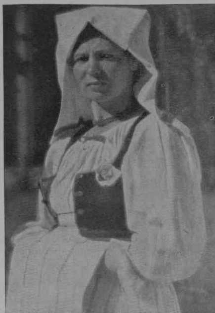
Ljubeščica (Hrvatsko Zagorje) Žena s pokrivalom pečo ali rupci