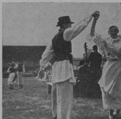
Prekmurski ples »Po zelenoj trati«