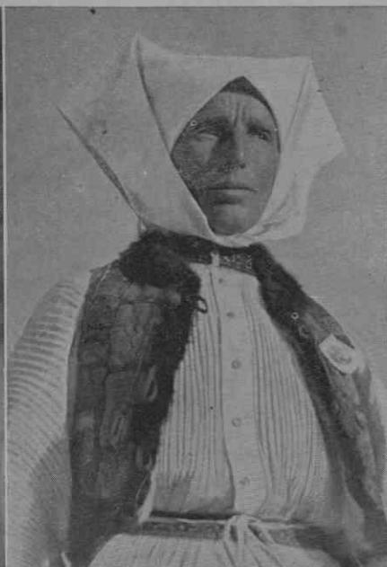
Lučelnica (Pokuplje pri Pizarovini) Žena z belo pečo in kožuhkom