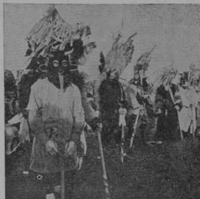
Štajerski zlodej, ozadju Kurenti