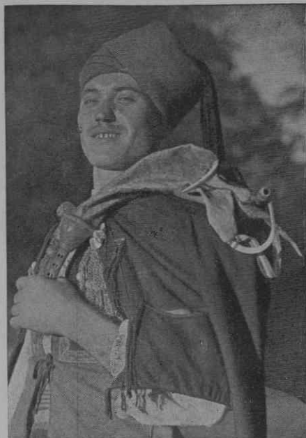
Donji Vinjani (dalmatinsko hercegovačka meja)