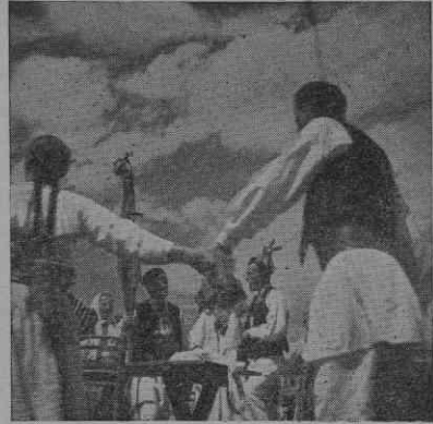
Poljansko svatsko kolo