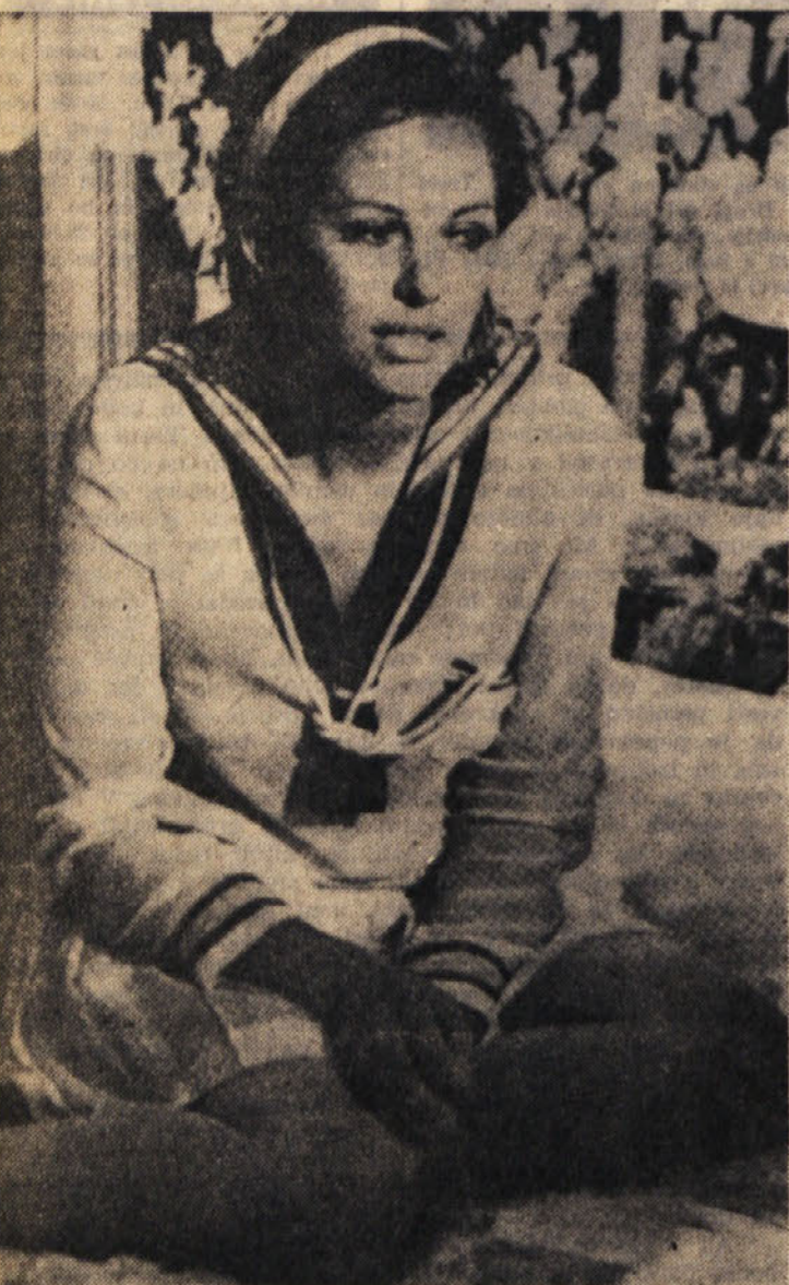
Claudia Cardinale v zadnjem filmu Franca Cristaldija «L'udienza»