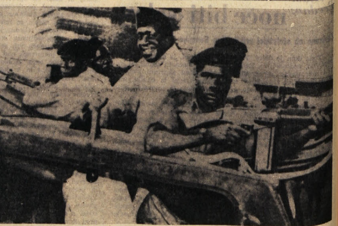
Kampala — General Idi Amin, ki je pred dnevi vrget z oblasti ugandskega predsednika Oboteja, se pelje po prestolnih ulicah v spremstvu do sob oboroženih vojakov

Policijskim organom se je posrečilo zapleniti 50 izvodov revije.