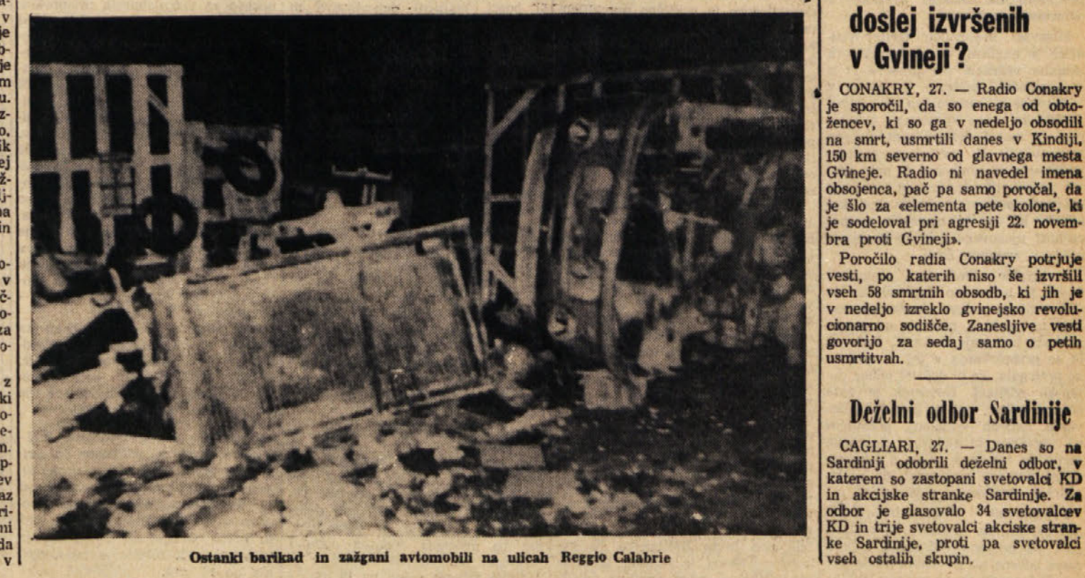
Ostanki barikad in zažgani avtomobili na ulicah Reggio Calabrii

Deželni odbor Sardinije CAGLIARI, 27. — Danes so na Sardiniji odobrili deželni odbor, v katerem so zastopani svetovalci KD in akcijske stranke Sardinije. Za odbor je glasovalo 34 svetovalcev KD in trije svetovalci akcijske stranke Sardinije, proti pa svetovalci vseh ostalih skupin.