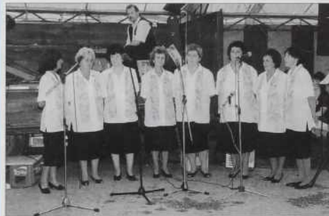
Pevke iz Števanovec

S tej uvodom se je začela prireditev 9. juliuša v Sotini na Goričkom, stero je pripravilo Odbor za turizem Občine