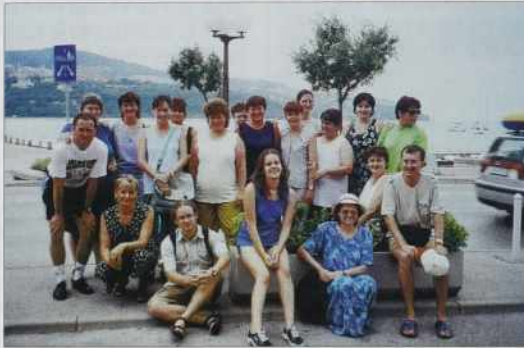
Naša skupina pri maurji