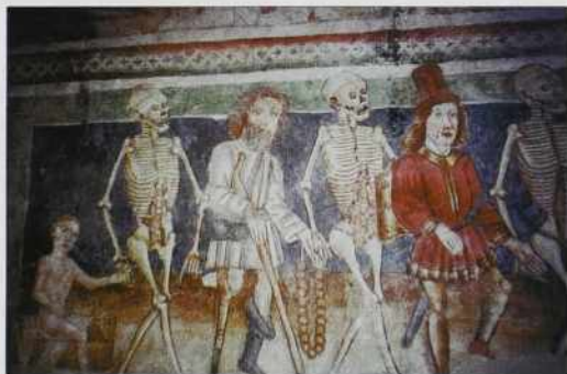
Mrtvaški ples v Hrastovljaj

kaupat. V kmici. Tak ka niške ne more praviti, ka sem ge nej čúden, ka na maurji vodnék v sobi spim, vnoči v ladnom vótri pa se kaupam. Gnauk sem se zatok v sunci tó leko kaupao. En dén smo meli izlet v Piran, šteri je drúgi najveksi pa po mojem najlepši varaš na slovenskom maurji. Zadvečerka smo spakivali svoje male turbe, gordjali sunčne aukule, vóšli na pomol (móló), pa lepau čakali na šift, šteri de nas v Piran pelo. Gda je prišo, so edni vrkaj na streji dojsedli, pa svoje tejló malo na sunce vódjali.