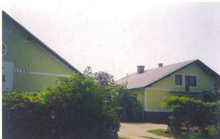
Dvorišče s stanovanjsko hišo in hlevom pri Kosovih, Trnovska vas 12