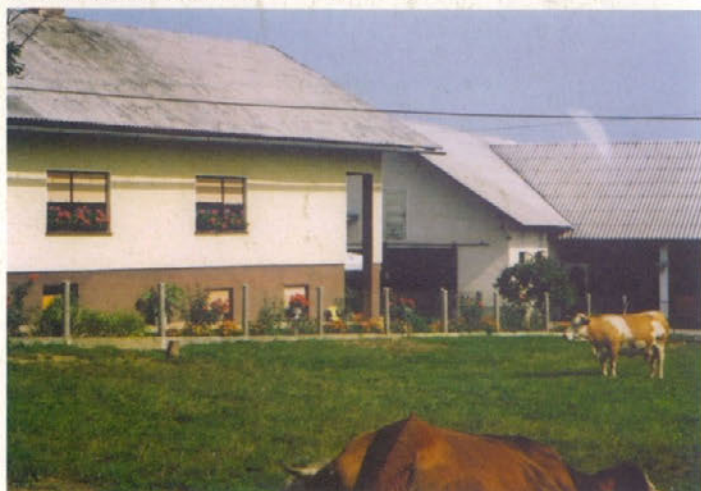
Domačija Matilde in Štefana Ivančič, Trnovska vas 6