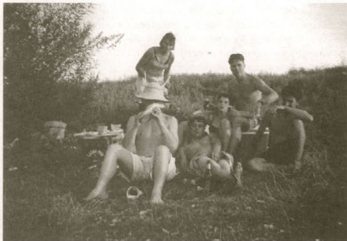
Najbolj zvesti udeleženci gasilskih taborov