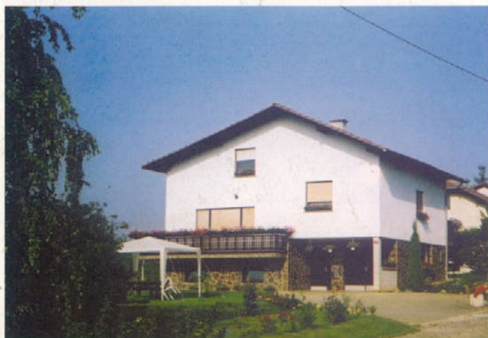
Pri Drumličevih v Bišu 8/a