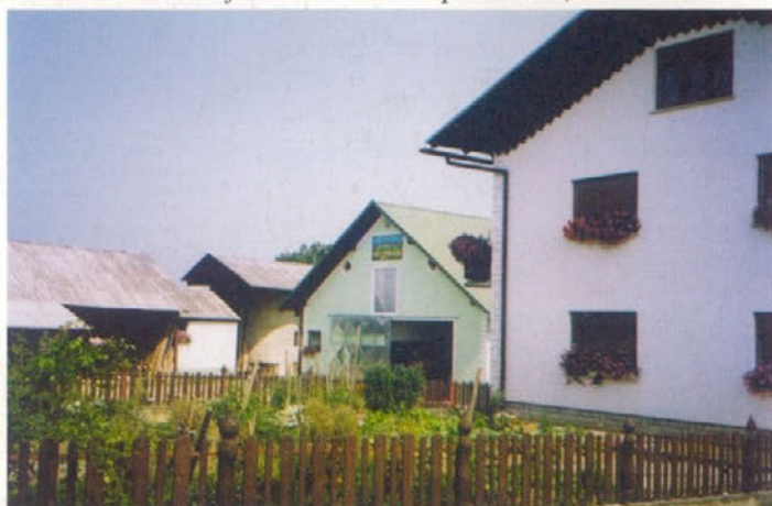
Domačija Mohorič, Trnovska vas 33