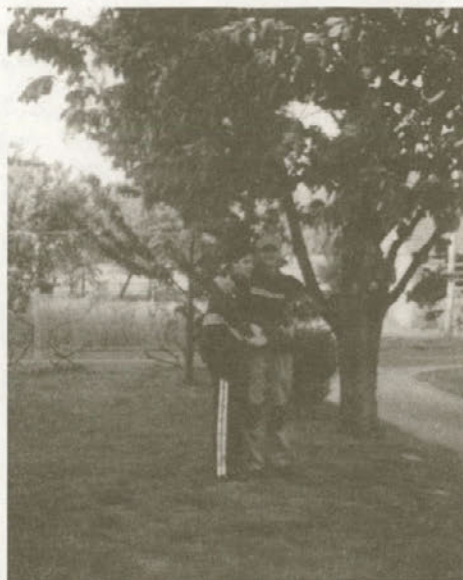
Dober prijatelj nikoli ne umre - samo daleč je...