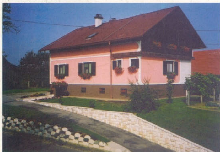
Pri Mesarečevih v Bišečkem Vrhu 6