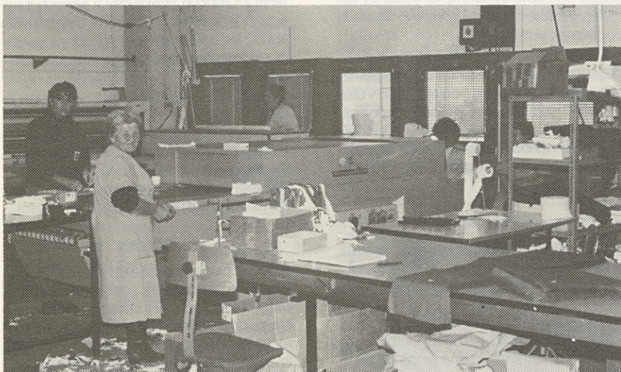
- Ta Niko! Kar slika in slika, slik pa od nikoder! - No, zdaj se lahko ogledate!

Volilna komisija ELKROJ Mozirje n.sol.o.