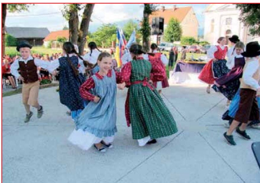
Tudi najmlajši so pokazali plesno-pevsko točko.