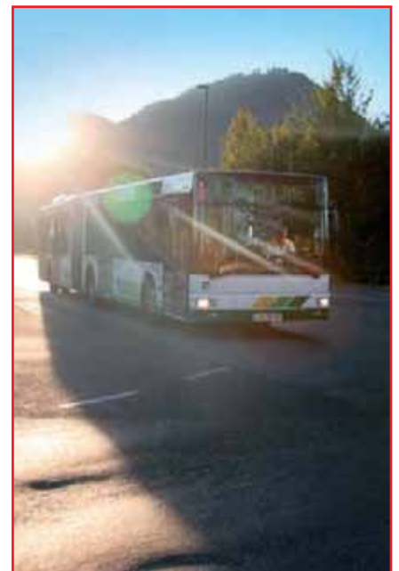
Vodičani so končno dočkali željeno linijo avtobusa.