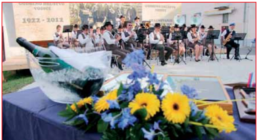
Godba Vodice je dopolnila 90 let.