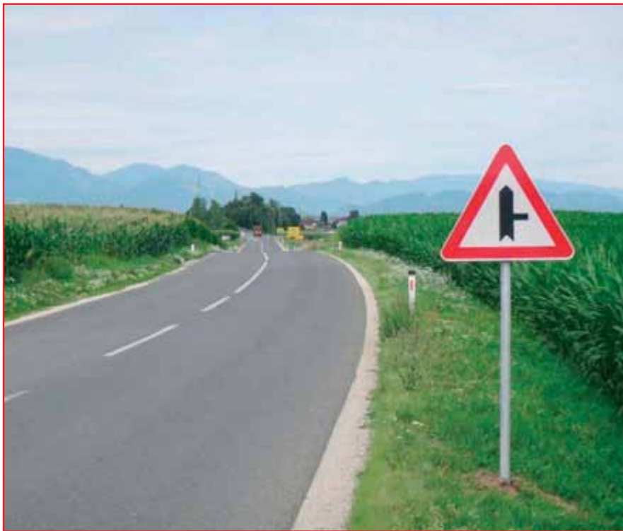
Odsek 1079 Zbilje–Vodice: 188,00 m 2