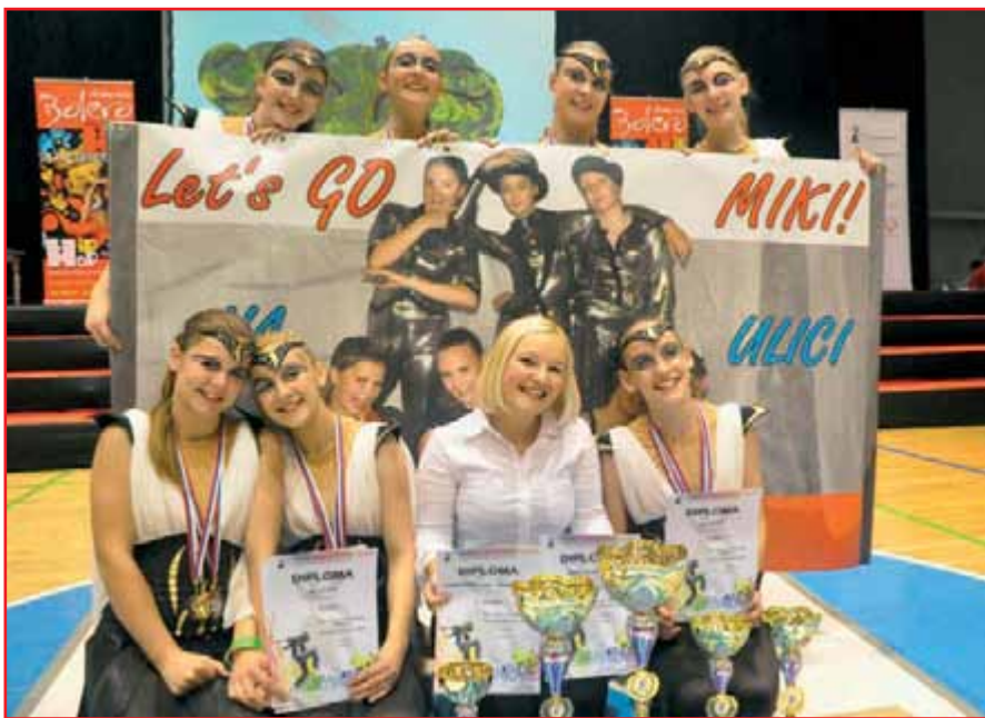
Zmaga je sladka.