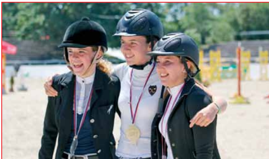
Vesetje ob priznanju

Na državno prvenstvo sem odšla neobremenjena s tem, kakšen bo rezultat, zato sem bila tudi veliko bolj sproščena. S trenerjem sva veliko trenirala za državno prvenstvo, vendar je bil moj cilj samo dobro odjahati. Vedela sem, da če bom dobro odjahala, bo goto-