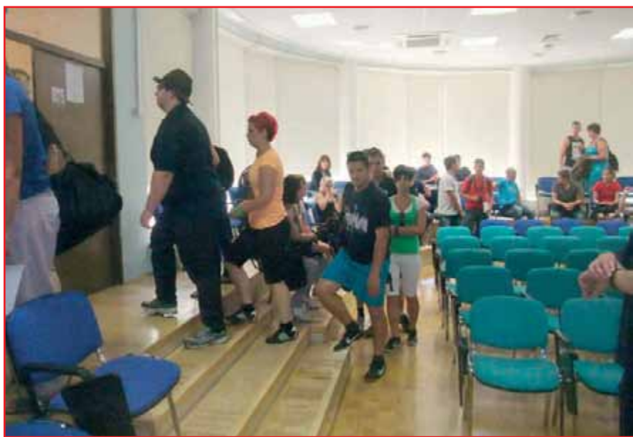
Mladi gasilci iz Slovenije, Hrvaške in Avstrije.