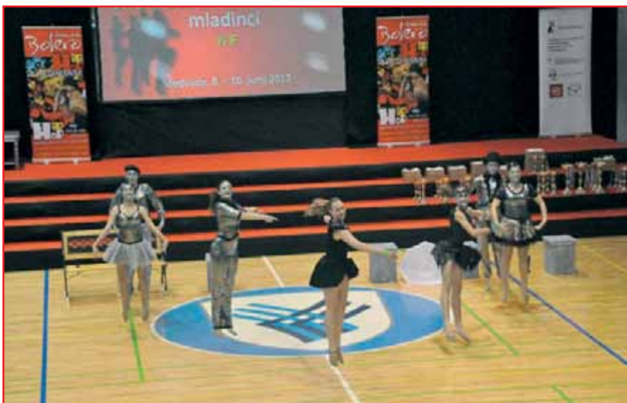
Točka na ulici