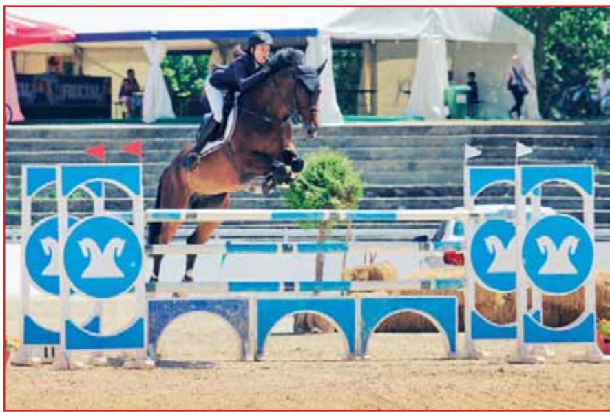
Ko človek in konj delujeta skladno.

Po mojih izkušnjah to popolnoma drži. Konji dobro čutijo, kaj se dogaja okoli njih. Konj čuti, če je jahač napet ali živčen, in se potem posledično tudi on tako obnaša. Konj in človek pa se po mojem mnenju čutita samo, če sta veliko skupaj. Svojega konja kar dobro poznam in vem, kako se v določenih trenutkih počuti. Včasih že v hlevu vidim, da je nervozen ali pa zadovoljen in tak je potem tudi