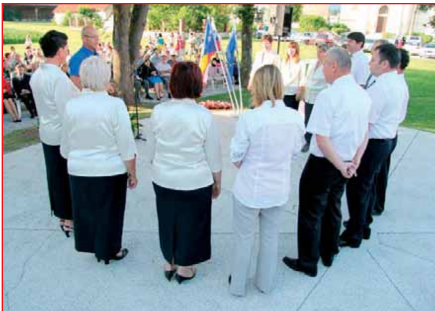
Ženski in moški glasovi združeni v pesem so dodali slovesen prizvok.