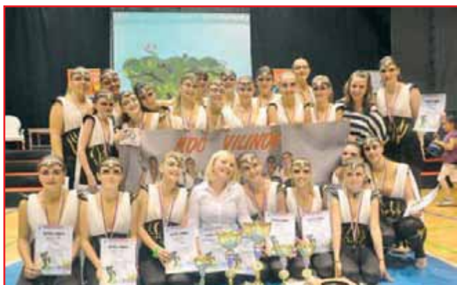
V Mikiju je kar nekaj deklet iz našega kraja.