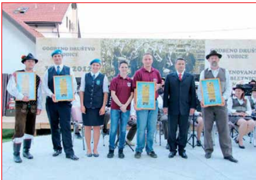
Priznanja so podeljena.