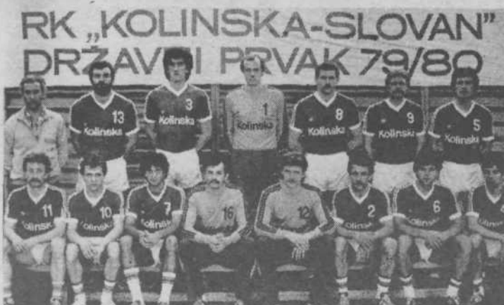
Rokometaši Kolinske-Slovana, državni prvaki 1979—80