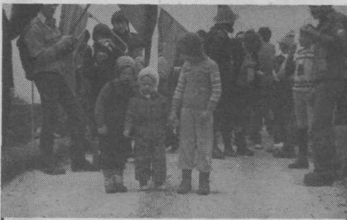
SLIKA S POHODA... Mlad, mlajši, najmlajši