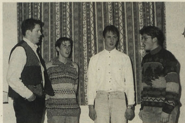
Mladi Vogrjani na prireditvi »Vsaka vas ima svoj glas«