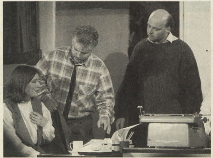
Ob »ščuki« so se srečali starejši in mlajši igralci