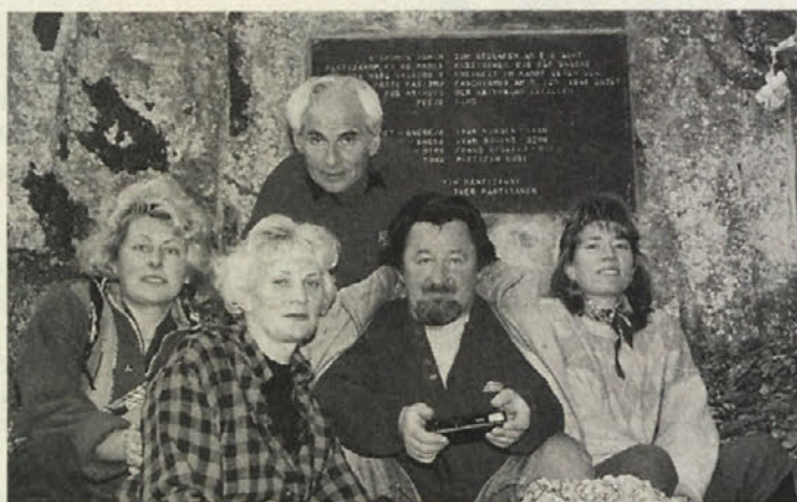
Pohodniki iz daljnega hrvaškega Samobora