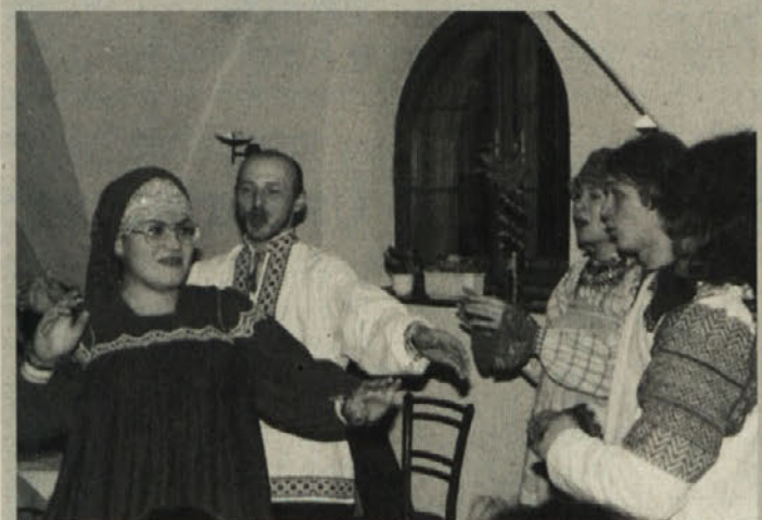
Pretekli četrtek je v gostilniških prostorih kulturne taberne pri Joklnu številnim gostom zapela in zaplesala skupina »Ruskvintet« iz daljne Moskve. Skupina ima že nekaj let stike s koroškimi Slovenci, nastopila pa je v več krajih južne Koroške. Na sporedu so bile domorodne pesmi, lok pa je segel od ljubezenskih, veselih do žalostnih pesmi. M.Š.