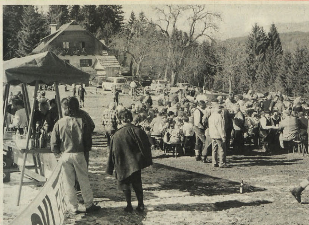
19. pohoda v spomin padlim partizanom pod Arihovo pečjo se je v nedeljo ob lepem vremenu udeležila množica obiskovalcev z obeh strani meje.

vsem na propagandi in komunikacijskih razvojnih možnostih. Na sejmu so organizirali posvetovalne centre, v katerih so gostinci in hotelirji lahko dobili nasvete strokovnjakov, udeležili pa so se lahko okroglih miz, različnih strokovnih seminarjev, pokusili pa so tudi kakovostna vina in kuharske specialitete. Na sejmu je bil tudi govor o fleksibilnem delovnem času, o izobraževanju vajencev in vajenk ter o cestni vinjeti. Tudi letos so potekala številna tekmovanja slaščičarjev, kuharjev, cvetličarjev itd. Kot lani so tudi letos kmetje in kmetice iz Zilje, Roža in Podjune številnim obiskovalcem sejma ponudili svoje specialitete. Organizatorji pričakujejo približno 25.000 obiskovalcev, od tega 1.500 iz Slovenije.