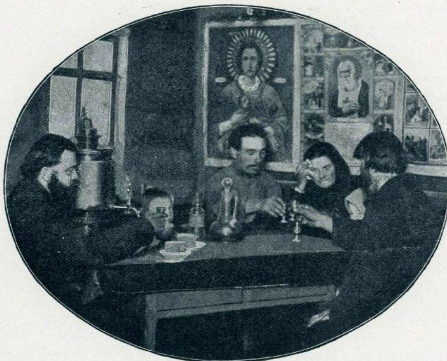
RUSKI RESERVIST SE POSLAVLJA OD RODBINE, PREDEN ODIDE NA BOJIŠČE.

Še na grobu bi plamtela v dihih blagih in iskrenih, in na prošnjah bi se njenih duša moja v raj povzpela.