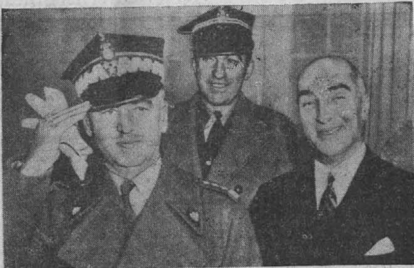
Mož na levi, ki salutira, je poljski premier, general Vladislav Sikorski, ki se je nahajal te dni v Washingtonu, odkoder je odpotoval zopet v London. Za njim stoji polkovnik Ilinski, na desni pa je Jan Ciechanowski, poljski poslanik v Washingtonu.