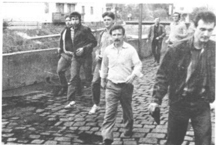
Oglasila se je sirena, kar najhitreje v gasilski dom