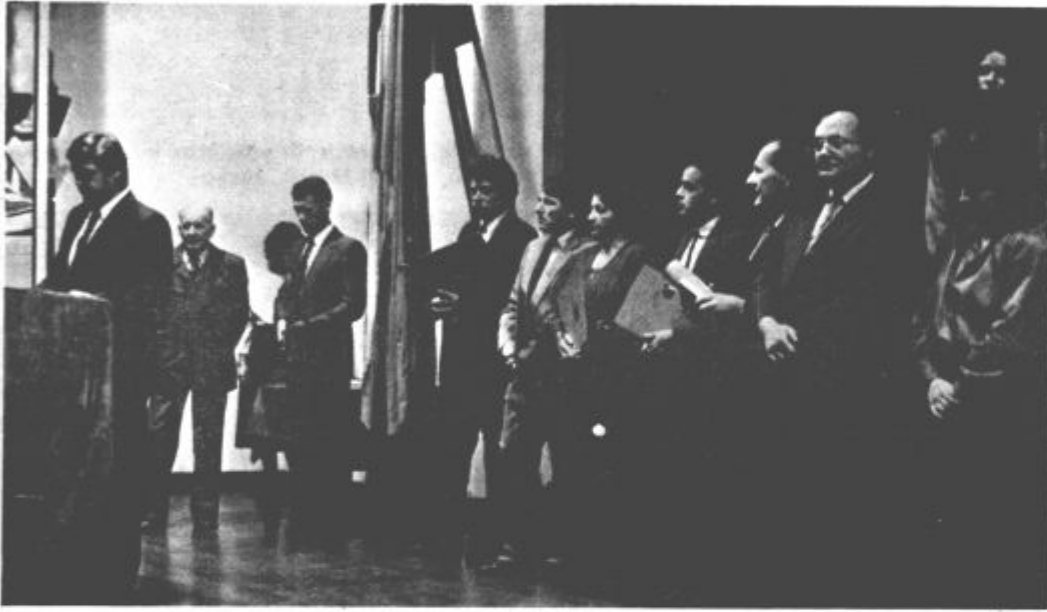
Dobitniki nagrad občine Velenje