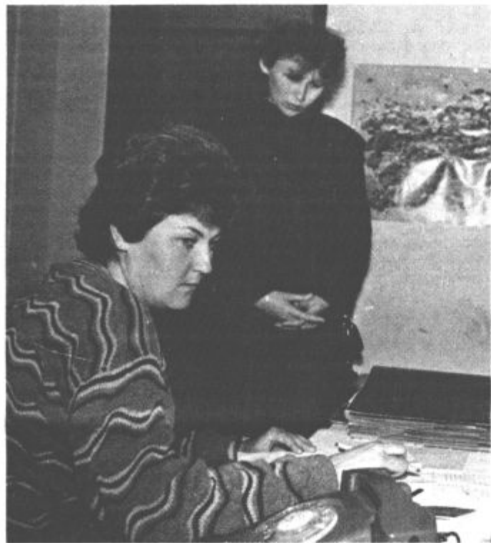
Skrb za socialno varnost pomemben element sreče na delovnem mestu

»Ko smo celovito analizirali delavski turizem vsa ta leta, smo ugotovili, da je takšen vzpon le-