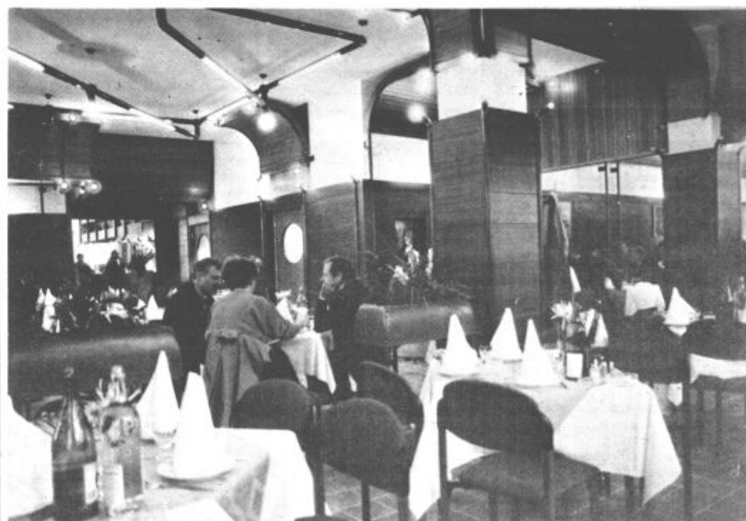
Za praznik so odprli tudi preurejen Delavski klub. Prvim obiskovalcem so zapeli člani Šaleškega okteta