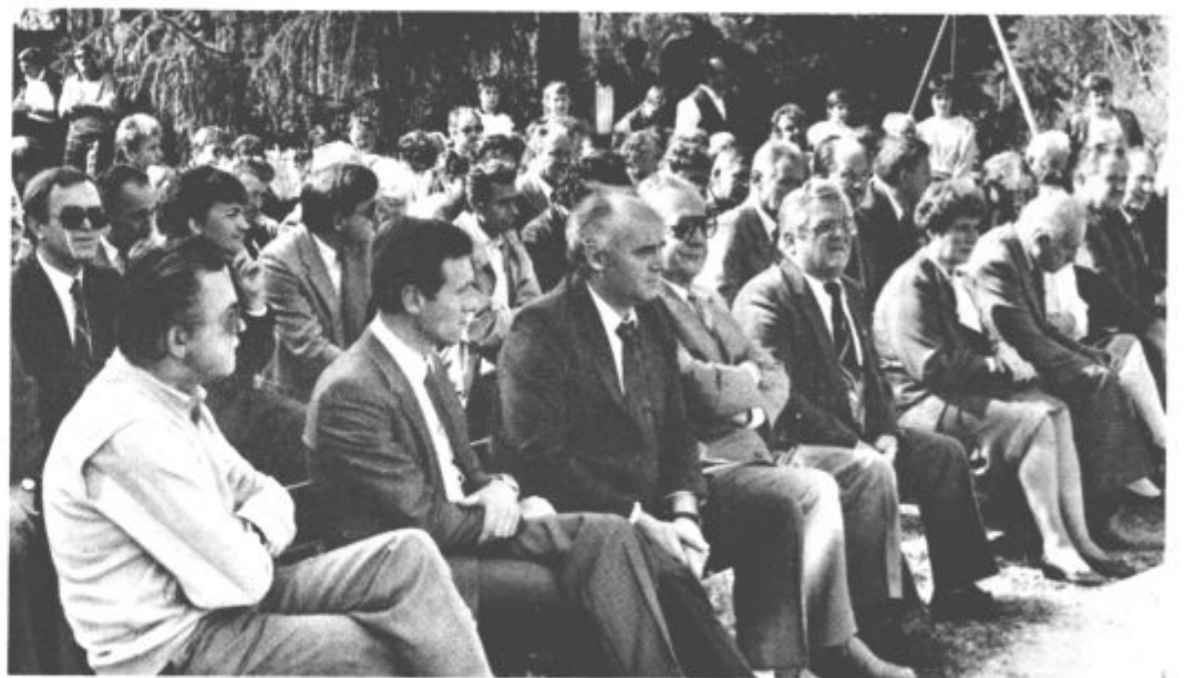
Praznično zborovanje v Belih vodah