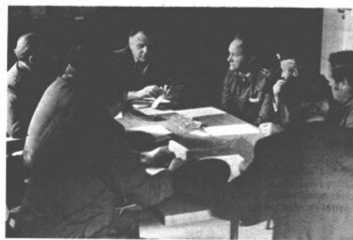
Vodstvo občinske gasilske zveze se je dogovorilo: »Vaja bo ...«