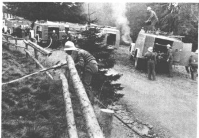
Takšne podobe planinska postojanka na Smrekovcu zagotovo še ni imela in upajmo, da je zares nikoli ne bo

gašenje in reševanje v oddaljenih hribovitih in gozdnih predelih. Ko smo že pri pomanjkljivostih, naj zapišemo še nekaj. Koroški gasilci na kraj požara niso prišli v predvidenem času. »Zakasnili« so zato, ker so na hitri poti po strmi in ozki gozdni cesti doživeli manjšo nezgodo, ki bi lahko bila veliko hujša. Ob tem se samo po sebi ponuja sklepno razmišljanje. Temeljna naloga humane gasilske organizacije in njenih članov je reševanje človeških življenj. Če gasilci torej ne bodo poskrbeli najprej za svojo varnost in svoja življenja, tudi drugim ne bodo mogli pomagati. To je treba upoštevati vedno in povsod. Seveda to ni »pomanjkljivost« ali očitak, le nujno spoznanje.