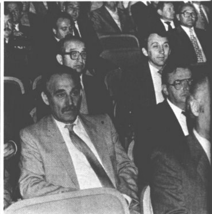
Delegati in gostje na slovesnem zasedanju

Ne morem si kaj, da ne bi v današnjih kriznih razmerah tudi sam zbral dovolj poguma za nekoliko drzno primerjavo, katere izhodišče je teza, da smo v sicer svobodni Jugoslaviji vendar na nek način resno okupirani. Zavojevalci, ki jih imam v mislih, niso prišli z orožjem in niso prišli kot sovražniki. Sami smo jih zaposlili za pomoč, za kredite, za tehnologijo, za znanje. Pomoč, ki smo jo dobili, nas je uspavala, nam omogočala hiter razvoj, ki ga nismo zaslužili s svojim delom in znanjem. In tako danes živimo v deželi, ki se ponaša z najvišjo stopnjo demokracije, ki je teoretično najbolj pogumno in najdlje zakorakala po poti socializma, pa vendar nismo svobodni. Namesto, da bi bili sveto