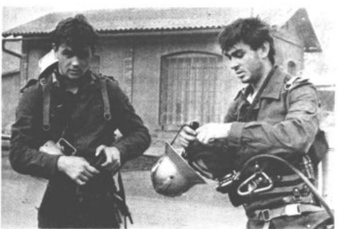
Bili smo uspešni. Tudi nama je zelo vroče, pa to ni pomembno. Samo, da smo preprečili najhujše