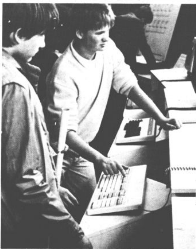
Gorenjeve novosti, razstavljene v »Jurčku«, so vse dni privabljale številne mlade

Letos bodo v okviru razstave tudi »Dnevi Gorenja«, ki naj bi predstavili utrip vsakdanjika delavcev Gorenja.