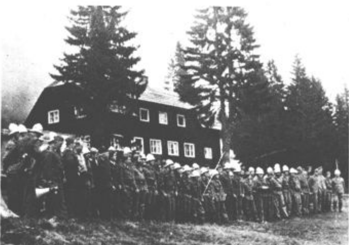
Sklepni del so namenili oceni vaje