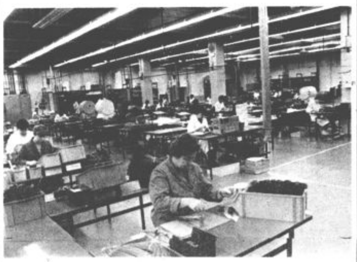
Nova tovarna je zares prostorna in sodobno opremljena