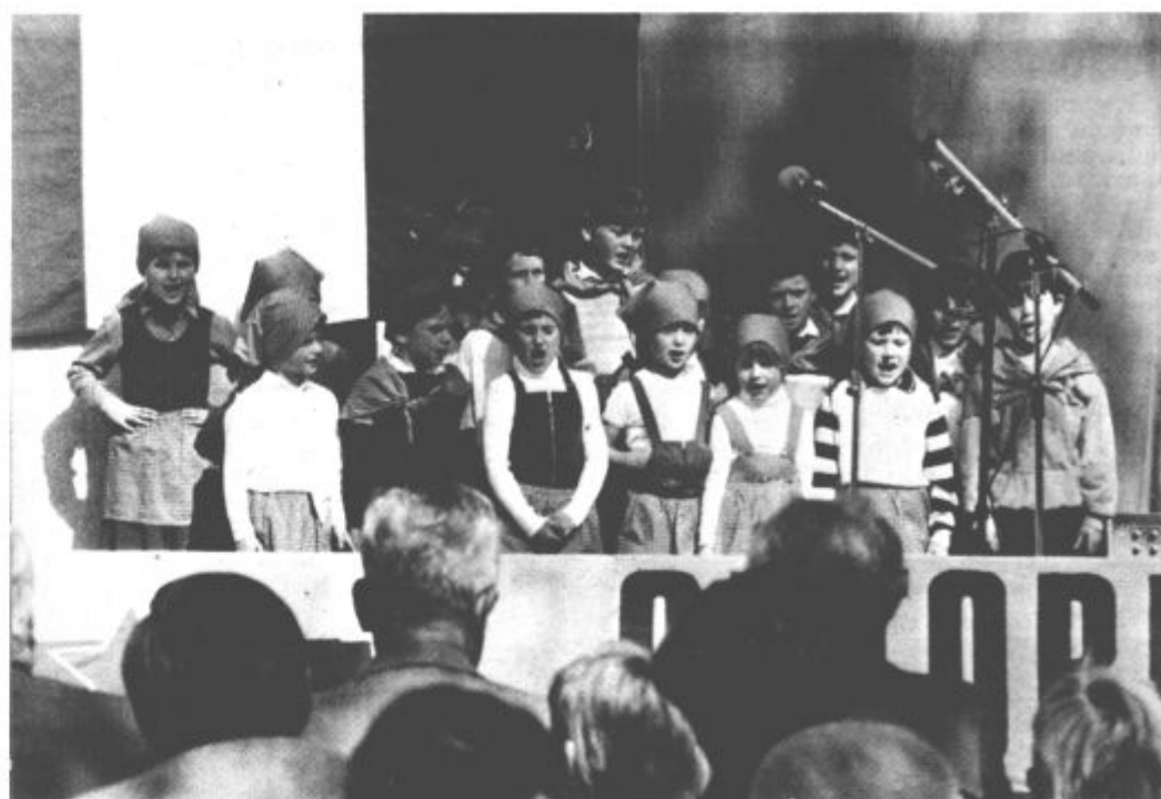
Domačini so pripravili lep kulturni program