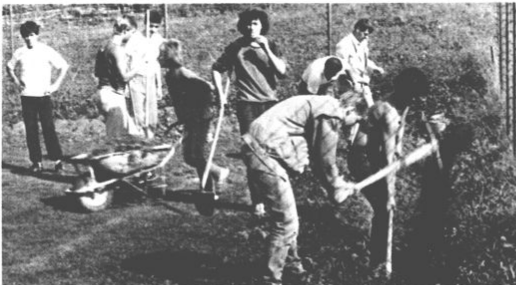
Šestdeset brigadirjev je urejalo okolico športnih objektov v Šmartnem ob Paki