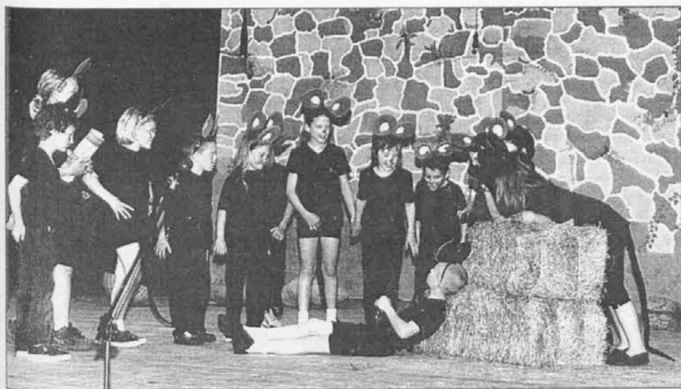
Nekateri miške pridno delajo, druge pa...

Gledališka predstava učencev Dvojezične šole za Mittelteatro