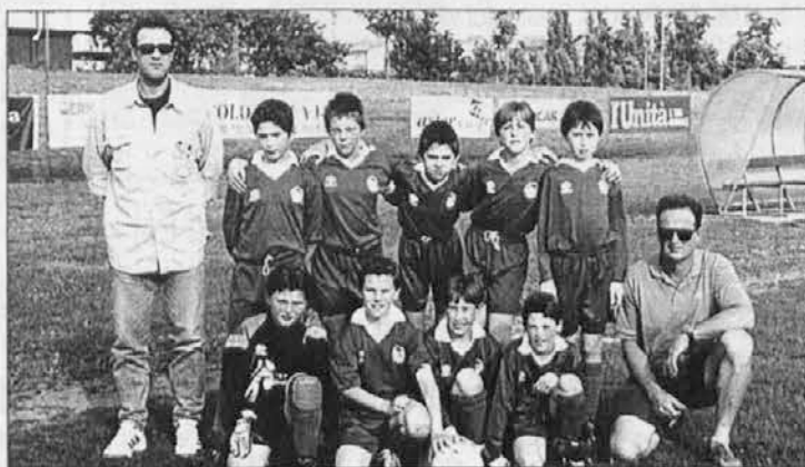
I Pulcini che hanno giocato il recente torneo di Pradamano