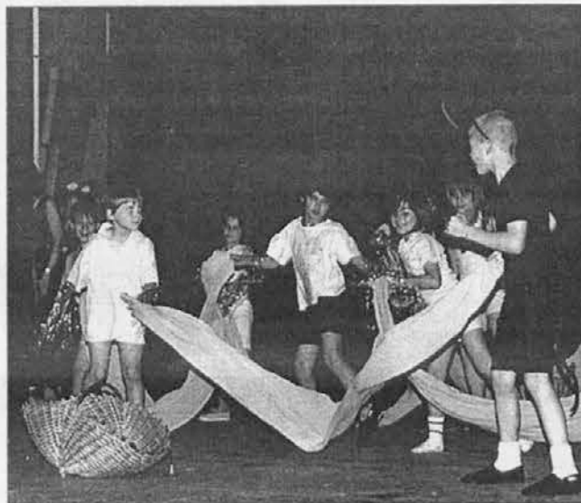
Učenci špetske šole med živahno predstavo

Na odru je bilo toliko prelepih trenutkov, da je težko podčrtati najboljše. Vsi so bili dobri, vsak zase do dobra premisljen in odlično prikazan, tako, da je cela predstava delovala veličas-