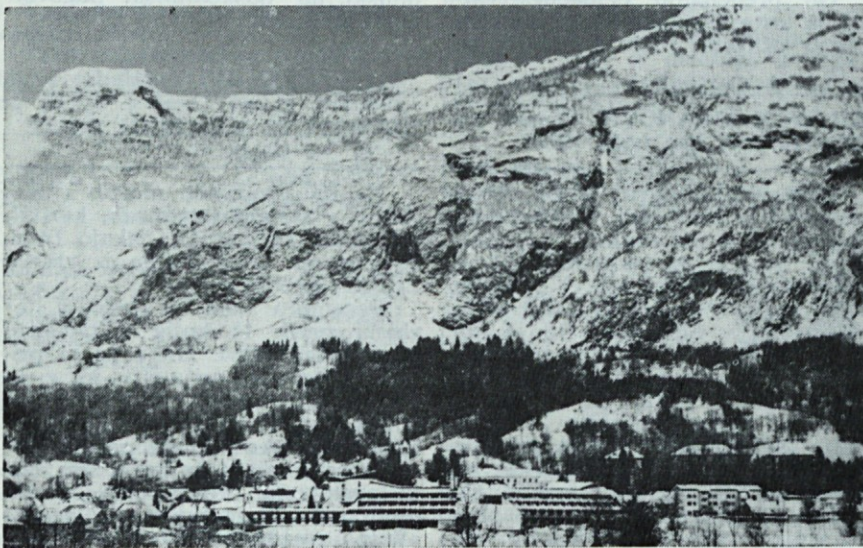
Hotel Kanin vabi.

Po govoru bo jubilanu Tekstini podeljeno odlikovanje predsednika republike, domicilnemu odboru komande goriškega vojnega področja pa listina o prevzemu pokroviteljstva Tekstine nad šiviljskimi in krojaškimi partizanskimi delavnicami na Primorskem. Slovesnost se bo nadaljevala s petnajstminutnim recitalom — literarnimi utrinki s tekstilno tematiko in končala z nekajminutnim nastopom pevskega zbora Srečko Kosovel iz Ajdovščine. (nadaljevanje na 9. strani)