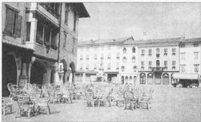
Uno scorcio di piazza Paolo Diacono a Cividale

I passi per arrivare ad un accordo, non del tutto facile soprattutto per una certa ritrosia manifestata da Manzano, sono stati seguiti