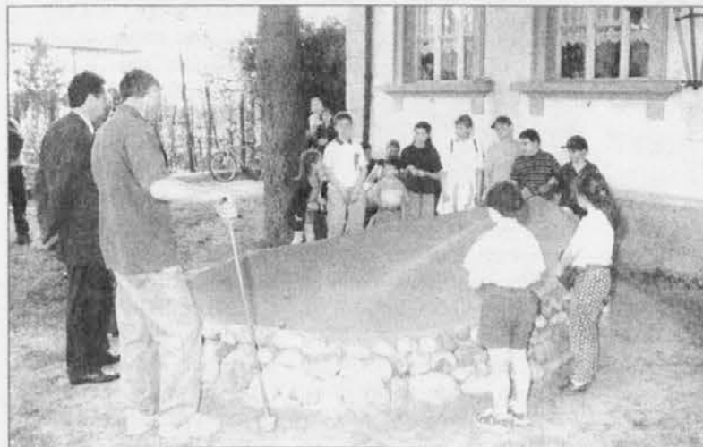
Pasqua: il tradizionale gioco del truc

Altrettanto calorose sottolineature sono state tributate all'autore del libro Claudio Mattaloni, il quale ha narrato le non poche difficoltà incontrate nell'azione di ricerca e d'indagine non solo nelle diverse bi-