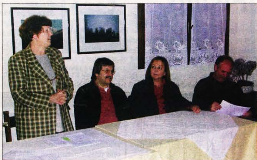
Večer o našem teatru na Klančiču

Tako se je v Beneciji začela tradicija, ki je vplivala na nastanek Beneškega gledališča in traja se danes.