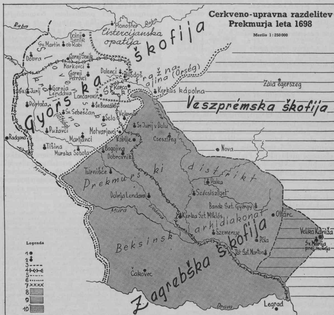
Zemljevid št. 2. Legenda: 1 kraj, 2 sedež župnije, 3 škofijska meja, 4 sedanja jugoslovanska državna meja, 5 bivša avstro-ogrska meja, 6 meja med župnijama Zelezno in Zala, 7 meja med distriktom Slovenska krajina (Tótságom) ter monaštersko opatijo in Stražno krajino (Orség-om), 8 ozemlje zagrebske škofije, 9 ozemlje veszprémske škofije, 10 ozemlje veszprémske škofije, ki je med leti 1695–1777 bilo pod upravo zagrebske škofije.

Med kraji, ki so l. 1698 spadali v župnijo Dolnja Lendava , pa ni Pince . Kraj Pince ( Pincze ) je pri štetju bil upoštevan pri župniji Kerka-Szent Miklós (na Madžarskem), kjer vizitator našteje v sedmih vaseh 1412 prebivalcev. Spet težava. Koliko od teh smemo prisoditi kraju Pince ? — L. 1831 je bilo v Pinczah 235 prebivalcev, 31 l. 1859 275 32 in l. 1889 268 33 . Na kraj Pince je v navedenih primerih odpadla 1/7 celotnega prebivalstva v župniji. Isto razmerje vzemimo tudi za