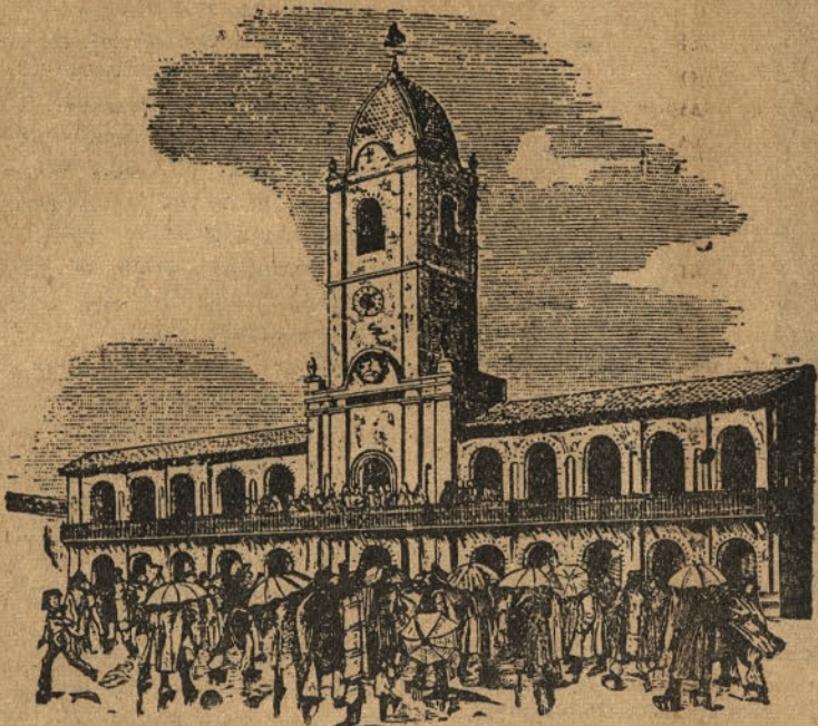
Cabildo abierto, cuna de la Independencia Argentina

Tako so s slovenskimi priseljenci ob prihodu v Buenos Aires postopali Argentinci. Tedaj pa smo doživljali, da so od diplomatskih predstavnikov sedanjih komunističnih nasilnikov v domovini nahujskani in zapeljani nekateri stari slovenski naseljenci prihajali v pristanišče pred emigrantski hotel izživat in