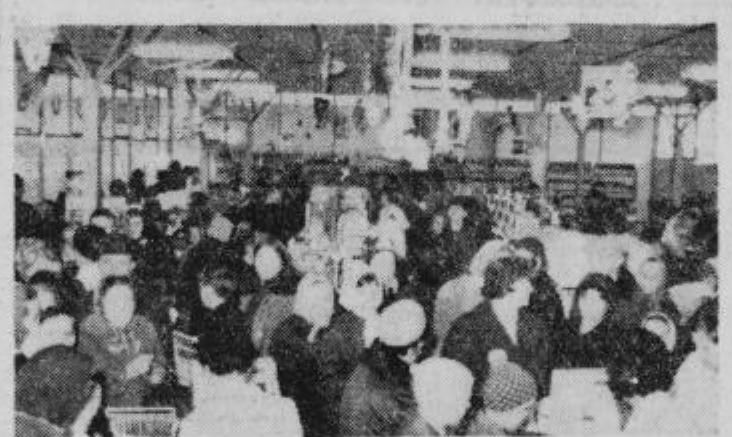
Tako po otvoritvi je bila samopostrežna polna kupcev

● In še želje za novo leto? Želim več kupcev, ki radi prihajajo v naše trgovine in jih zadovoljni zapuščajo. Njim in drugim občanom zdravo in srečno novo leto!