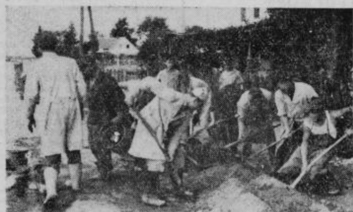
Pri obnovi trgovin je bilo treba prijeti za lopate

V objektu so vsi potrebni elementi za obdelavo prehranskih artiklov, večji hladilni prostori in hladilniki. Spodaj so prostorna skladišča.