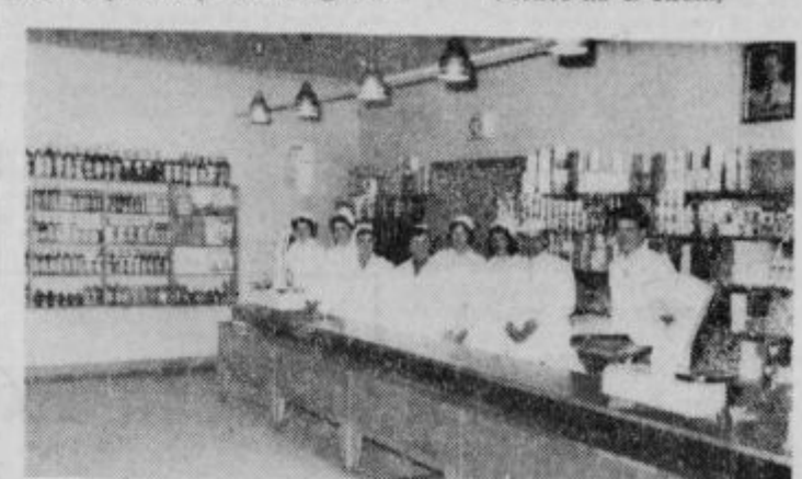
Hrana — vpeljana trgovina z živili

bodo vanj preselili že obstoječi objekt bo paviljonskega stila prodajalni Potrošnik in Novi dom na Bregu. Nova trgovina bo primerna času in potrebam. Upajo, da bodo v njej lahko postregli prvim kupcem že maja z Brega bo v novi trgovini klameseca prihodnje leto. Trgovski