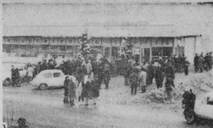
Samopostrežba IZBIRA pred otvoritvijo

V sredo, 27. decembra 1967, je trgovsko podjetje IZBIRA iz Ptuja slavilo nov uspeh svojega dela. Odprlo je sodobno samopostrežno trgovino ŽIVILA na Ljutomerski cesti.