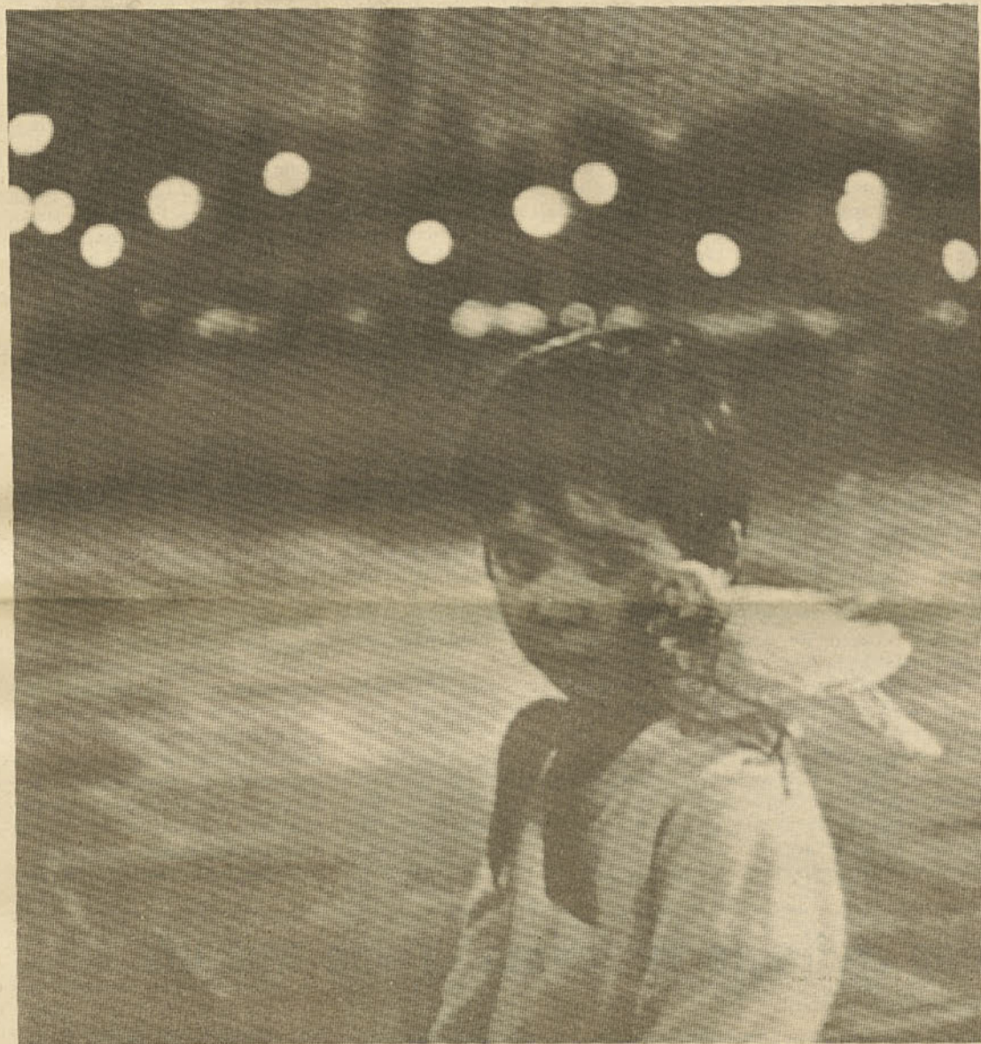
Robert Dolsneau: Otrok in golob, umetniška fotografija, 1958