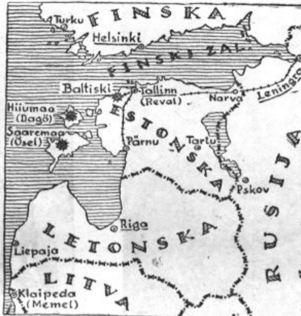
Merilo: 50 100 150 km * ruska voj. oporišča Zemljevid baltških držav. Kakor omenjamo na drugem mestu, si je Rusija v sedanjih zmedah zagotovila prevladujoč položaj v Baltiku.

O vojaški pogodbi med obema velesilama se sicer dosti govori, vendar so to samo ugibanja, katerih resnične podlage in vsebine v širši javnosti bržkone nihče ne pozna.