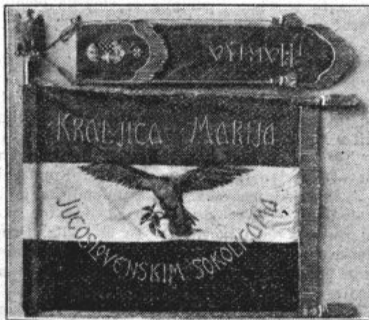
Prapor kraljice Marije so si v tekmi pridobile ljubljanske Sokolice (tekmovalna vrsta Sokola Ljubljana).

Kmetško delo na polju se je v glavnem dokončalo, sedaj pridno v goricah pospravljamo letošnji pridelek grozdja. Toča nas je letos izpučila, zato gremo z veselimi obrazi v gorice; trgategv je namreč zelo lepa, ne vemo pa, če bomo vino lahko prodali. Kakor koli pač bo, po opravljenem delu za vsakdanji kruh bomo skozi zimo v toliko bolj delali za dobrobit naše izobrazbe. Poleg predavanj in delavskih večerov bomo skušali tudi dvigniti naše dramatično delo. Storili bomo vse za prosveto in izobrazbo vasi.