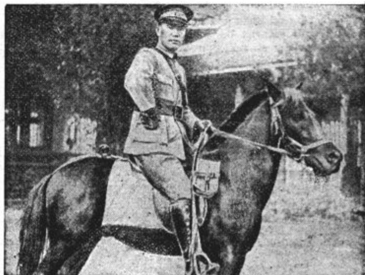
Zgoraj desno: Nemški zunanji minister v. Ribbentrop, ki je pred kratkim podpisal v Moskvi nove pogodbe Nemčije z Rusijo. — Spodaj levo: Takole previdno in oprezno so ruski vojaki prekoračili rusko-poljsko mejo in začeli zasedati ukrajinsko ozemlje nekdanje Poljske. — Spodaj desno: Maršal Čangka jšek, vodja Kitajcev. O njem pravijo, da je sedaj pripravljen na pogajanja z Japonsko s posredovanjem Združenih držav.