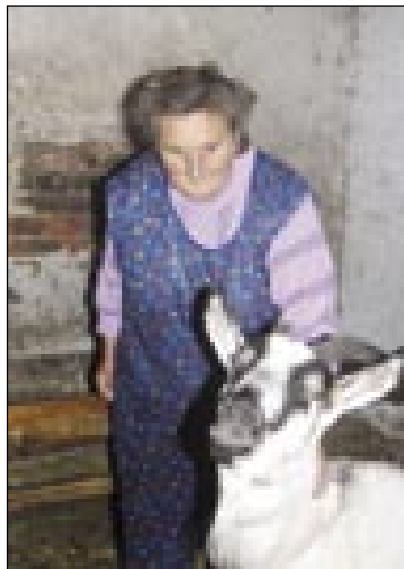
Kozino mlejko je dobro za pečti, drugo pa damo mački pa pisej

»Od tistoga mau, ka je v Otkovci bauto, od tistoga mau mi ta odimo, zato ka je skrajaj pa nej trbej na brejg titi. Jaj, gda pa dolaspadne snejg, te je ešče vrag. Dočas, ka ga samouprava ne potisna dola, dočas se mi ranč djenti ne moramo. Tak vidiš, kak daleč je odtect pošťija.«