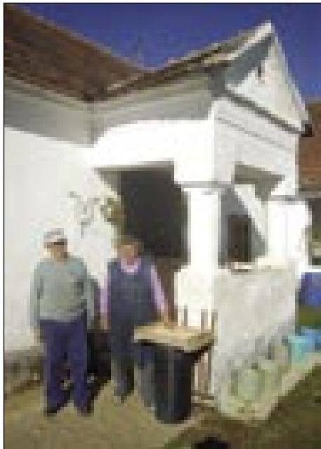
Pred svojim lejpim ramom, škoda, ka je takšni več samo malo v Porabji

ciuša smo šli pa smo do novembra tam delali. V zimi smo pa doma bili. Na pa te, gda sva se spoznala, za dve leti, šestdesetdrugoga sva se oženila.«