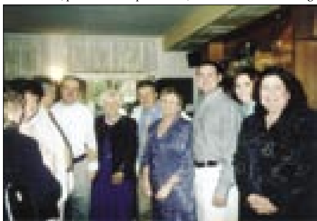
En tau žlate na srečanjij, gde je nas bilau kaulek šestdeset