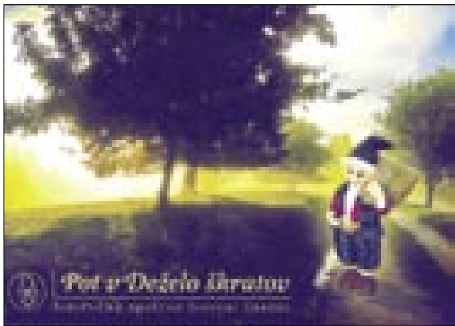
Škratí zovéjo v svojo deželo

Šentanel je stara koroška vesnica, znana po mošti in dobroj künji, gnesden trno turistična, v vesnici pa najdete poulek mira paverski muzej Dvornik tō s starim škerom, vcüj pa vam povejo, kak so inda vertivali.