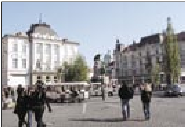
Turistični vlakec na Kongresnem trgu

Peljali smo se preko mejnega prehoda Martinje, mimo Murske Sobote, Maribora in Celja. Med potjo smo se ustavili na kavico ali sok. Okrog 11. ure smo že bili v Ljubljani. Nisem vedela, da je Ljubljana tako majhna, kljub temu je zelo lepa in zanimiva. Bila mi je všeč. Najprej smo obiskali Prirodoslovni muzej . Tam smo si ogledali naravo Slovenije. Na razstavi smo videli živali, ptice, rastline, minerale in školjke. Potem smo imeli kosilo v restavraciji, ki se je imenovala Skriti kot . Po kosilu smo dobili prosto, da malo