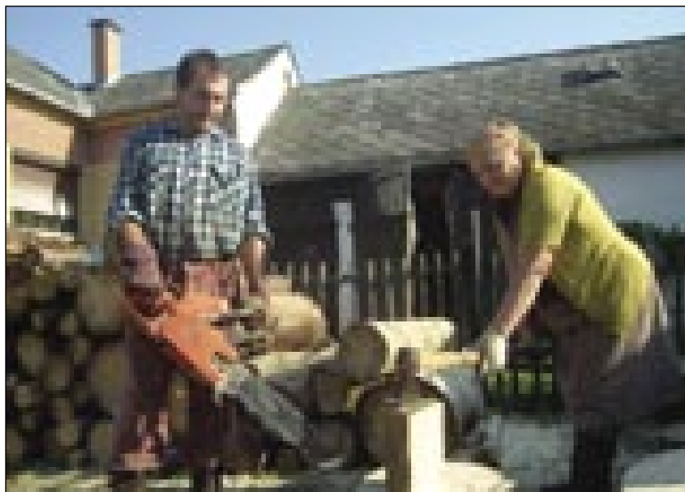
Žaga je tō dobra, dapa zatok brezi tapače nede

»Gda ma nakriva dé, gda duge žaga, pa dje tak, ka se špila z menov. Tašoga reda ga te malo dolazmrdam. Drugo pa tau, ka dosta sak-