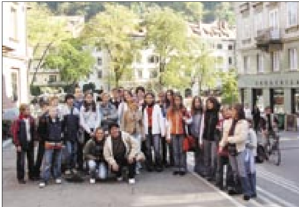
Skupinska slika v stari Ljubljani

preko Ljubljanice peljali na grad, kjer smo si ogledali film o zgodovini Ljubljane. Grad je v zelo dobrem stanju. Na