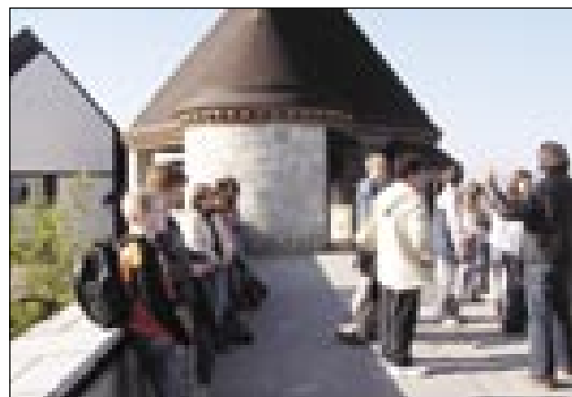
Na ljubljanskem gradu

V Ljubljani mi je bil najbolj všeč grad. Že pot do grada je bila zanimiva, ker smo se pe-