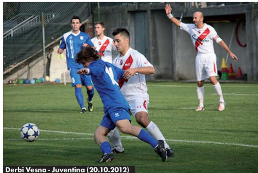
Derbi Vesna - Juventina (20.10.2012)

derbi na solidni tekmovalni ravni. Lep sobotni popoldan v Križu, veliko gledalcev, med njimi tudi nekateri ugledni predstavniki našega prostora, ves zamejski in tržaški amaterski nogomet, kar nekaj osmink in vrčkov piva pri kiosku. Zaslužena zmaga domačinov proti favoriziranim gostom. Borbena tekma, bučno