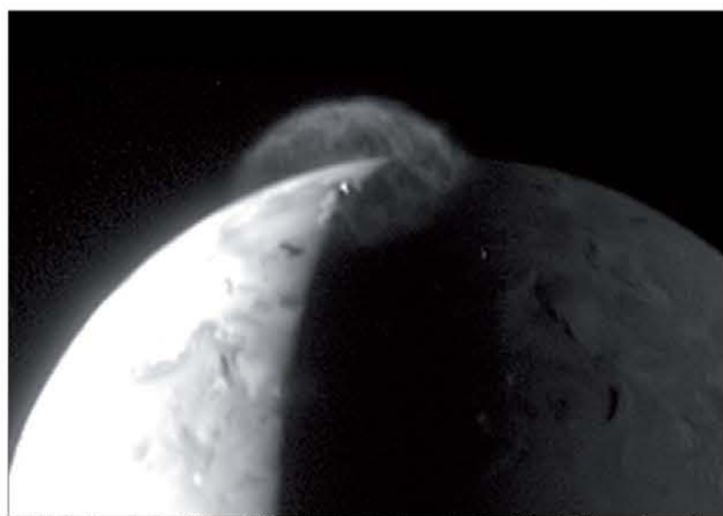
Velik izbruh na luni Io, kjer se oblak iz žveplovih plinov dviguje več kot 300 km nad površino

tekočega žvepla. Io močno interagira z Jupitrovim magnetnim poljem in bistveno pripomore k njegovi obliki. Njegova magnetosfera odnaša pline in prah iz lunine redke atmosfere