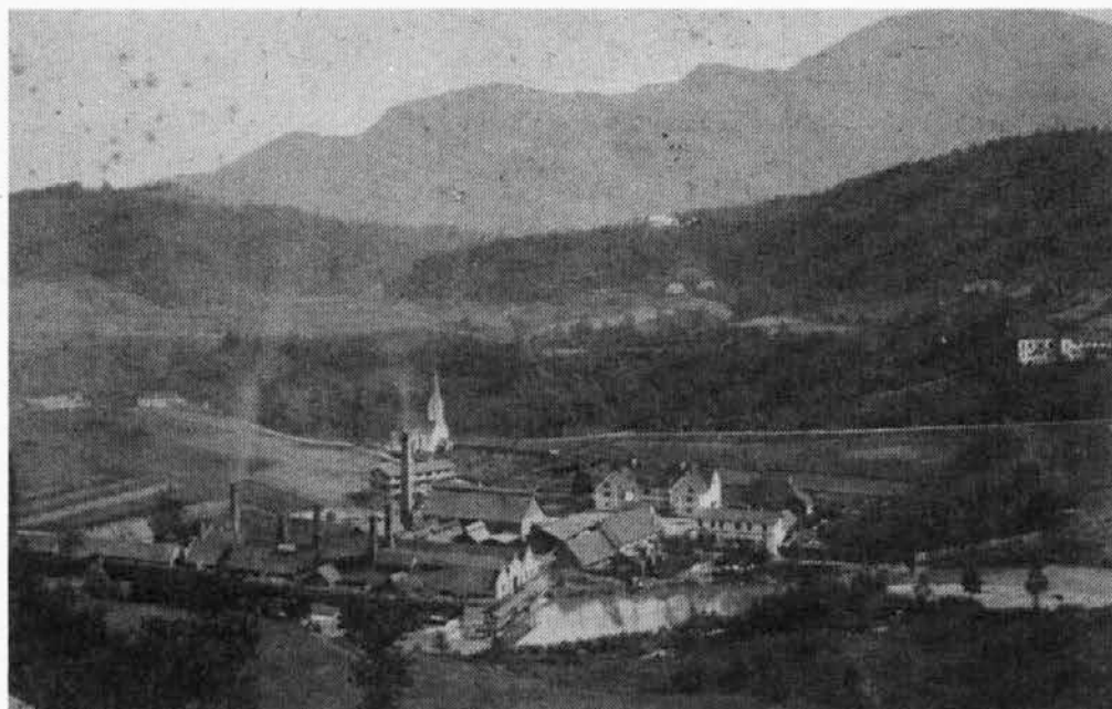
Ena najstarejših fotografij jeklarne na Ravnah (posneta leta 1875)

Ob (okroglih) obletnicah delovanja podjetij je običaj, da izidejo priložnostne publikacije.