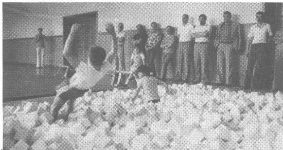
Gimnastični delavci Ljubljane, predvsem pa Partizana Trnovo, so po večletnem trudu uspeli zgraditi prvo skakalno jamo v Ljubljani. Skakalna jama ustvarja varno učenje najzahtevnejših gimnastičnih prvin, ki jih zahteva sodobna športna gimnastika.

starejši pionirji ter pionirke, ki so tekmovale vse v eni kategoriji. Kljub temu da rezultati niso najbolj pomembni – važnejše je tekmovanje kot prireditev in nekakšen zbor krajanov, starih in mladih iz Vnanjih Goric in okolice – vseeno pogledjmo najboljše: