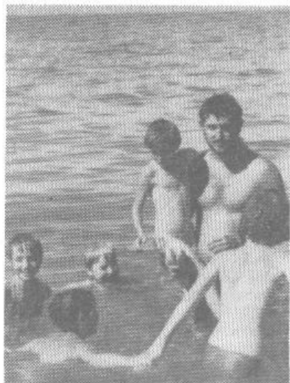
Tudi letos bo prišlo iz Pacuga veliko mladih plavalcev.