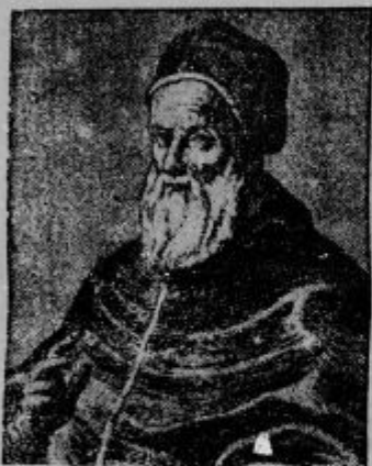
Papež Gregor XIII.

Opera Metropolitan v Newyorku, ki jo je l. 1908 ustanovil Vanderbilt na združni podlagi, je valov izstopa mnogih članov začela v veliko denarno krizo. Naša slika predstavlja tako imenovano »zlato podkev«, lože ameriških milijonarjev.