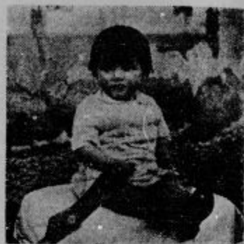
- Kdo me pozna?

Poslednja slika Lindberghovega sinčka. Ze pred dvema tednoma so razbojniki ukradli 19 mesecev starega sinčka znamenitega letalca. Vsa Amerika je še vedno ogorčena nad razbojniki in nad policijo, ki se ji še ni posrečilo, izslediti krutih zločincev.