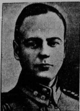
General Wallenius, voditelj finskih fašistov. Upor, ki so ga poskusili, se je ponesrečil, general je zbežal v tujino.