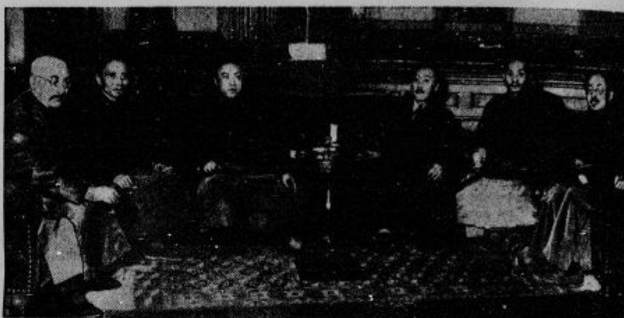
Ustanovitelji mandžurske republike.

Pod zaščito japonskih čet in na pritisk Japoncev so ustanovili na Daljnem vzhodu novo državo republiko Mandžurijo, kakor smo že poročali. Nova država meri 1 milijon dvesto tisoč kvadratnih kilometrov in ima 28 milijonov prebivalcev. Na sliki: predsedniki štirih kitajskih provinc in deželni župan glavnega mesta Mukdena, ki so sklenili, da se njihove province združijo v republiko pod vodstvom Čingčenga Puja.