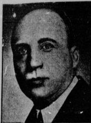
Dr. Ludvik Walko, madjarski zunanji minister se je podal na politično potovanje v Ženevo, Rim in Pariz, da se posvetuje z vodilnimi politikami o podnavski konfederaciji.