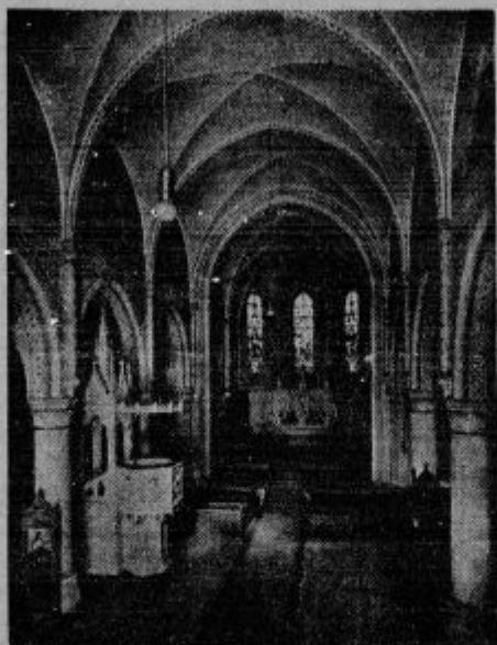
Katoliška katedrala v Sarajevu, ki so jo okusno prenovili. Krasta stavba vzbuja splošno pozornost.