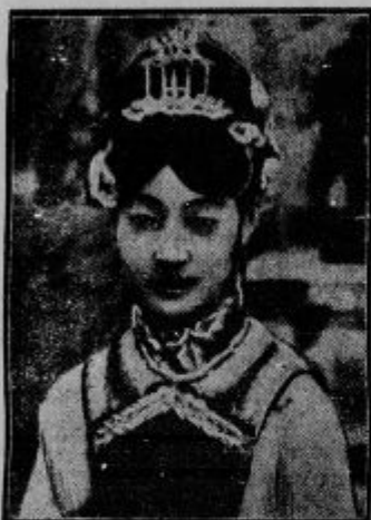
Soproga mandžurskega čingčenga, bivšega kitajskega cesarja Henry Puji. Z velikim pompom se je novi vladarski par naselil v vladno palačo v novem mandžurskem glavnem mestu Čingčenu.