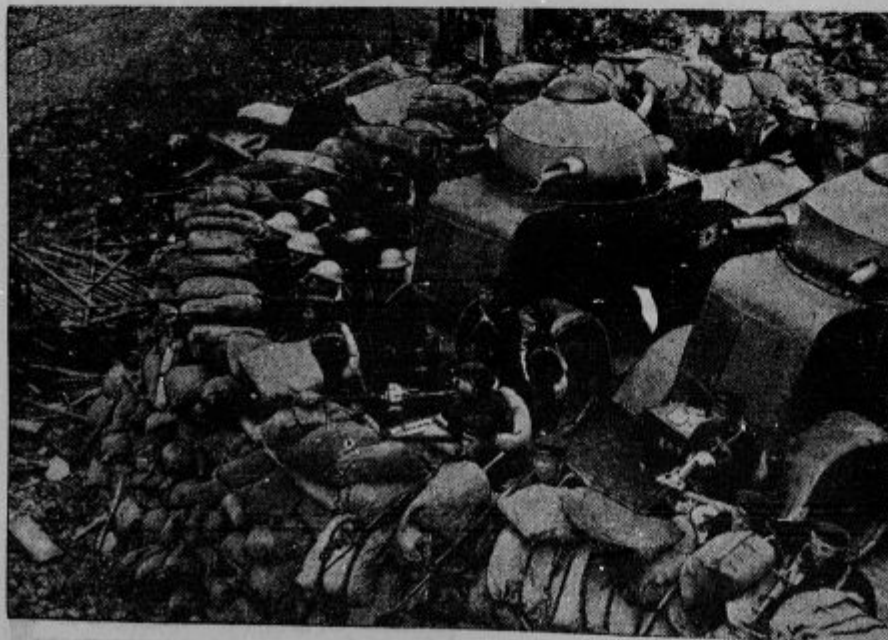
Japonske barikade v zavzetem delu Sanghaja.

Pod zaščito japonskih čet in na pritisk Japoncev so ustanovili na Daljnem vzhodu novo državo republiko Mandžurijo, kakor smo že poročali. Nova država meri 1 milijon dvesto tisoč kvadratnih kilometrov in ima 28 milijonov prebivalcev. Na sliki: predsedniki štirih kitajskih provinc in deželni župan glavnega mesta Mukdena, ki so sklenili, da se njihove province združijo v republiko pod vodstvom Čingčenga Puja.