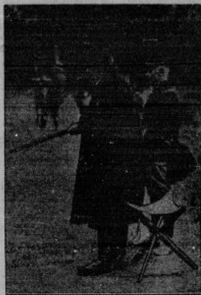
Briand na levo. Največja zabava in strast pokojnega državnika je bila lov na divje rase.