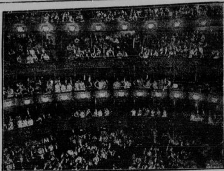
Največja opera na svetu v krizi.

Opera Metropolitan v Newyorku, ki jo je l. 1908 ustanovil Vanderbilt na združni podlagi, je valov izstopa mnogih članov začela v veliko denarno krizo. Naša slika predstavlja tako imenovano »zlato podkev«, lože ameriških milijonarjev.