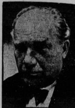
Eugen d'Albert, veliki nemški komponist, je umrl v Rigi, star 68 let. Od njegovih del je najbolj znana opera »Tiefland« (Nižava), ki so jo z uspehom dajali tudi v Ljubljani.