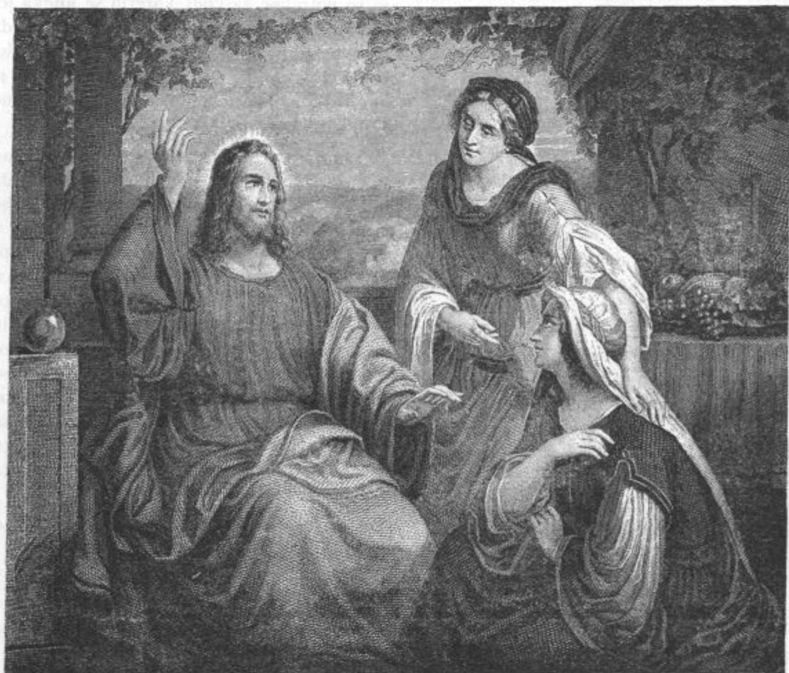
Jezus pri Marti in Mariji.

Ko so rabeljni slišali Lavrencija govoriti o zakladih, sporoče to cesarju. Ta pa, ravno tako lakomen kakor krvoželjen, ukaže svetnika prijeti in ga izroči nekemu plemenitemu častniku Hipolitu. Le-ta dene Lavrencija v ječo, kjer je bilo že mnogo hudodelnikov.