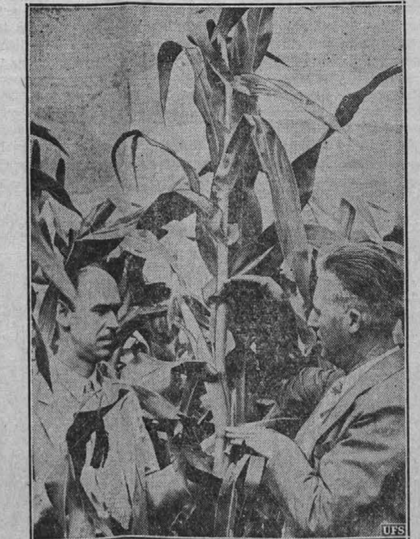
Slika kaže, ko poljedelski strokovnjaki pregledujejo koruzno polje blizu Wauke, Iowa. Vsled zadostne moče, kaže letos koruzna letina izredno dobro.