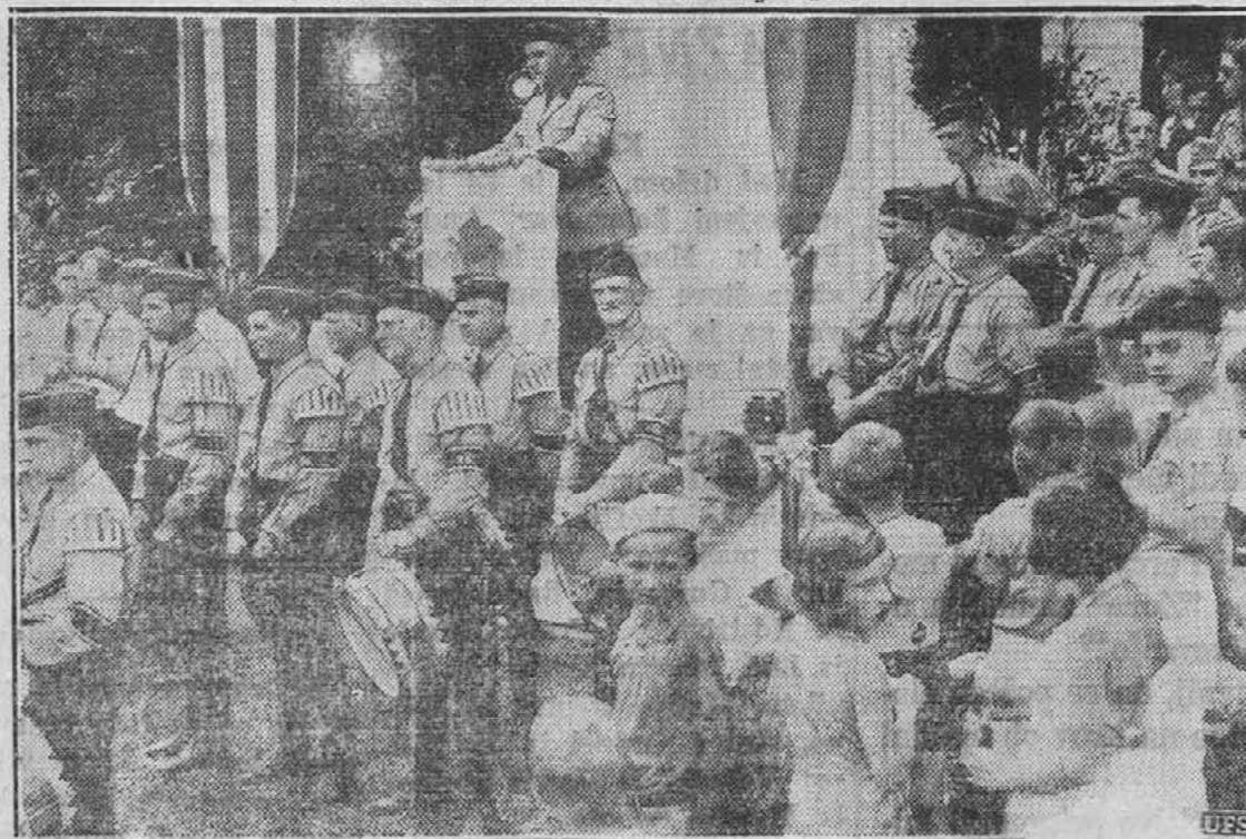
Slavnostna otvoritev nemške letoviške kempe v Andover, New Jersey, kjer so nemške organizacije kupile 150 akrov zemlje in jo priradile v letoviško kemp, kjer bodo učili nemško mladino med počitnicami atletiko in drugih predmetov. Nasprotniki nazivajo to organizacijo obtožili, da širi med ameriški Nemci nazijsko propagando.