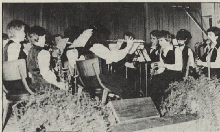
Godba na pihala je živahno zaigrala nekaj lepih komadov.

To so pokazali društveniki tudi na slavnostni prireditvi, ki je zrcalila bogato kulturno-prosvetno delo današnjih društvenikov.