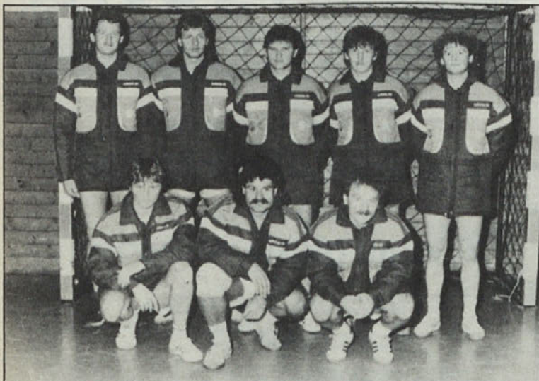
SAK je tovarna Iskra-Delta podarila nove športne obleke, s katerimi bo šel na priprave v Umag.