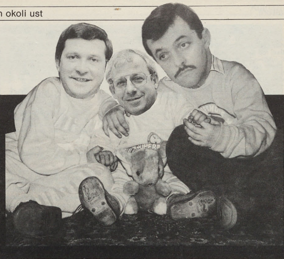
Sliki iz otroških let: • levo: koroški tristrankarski paket „Koroške enotne stranke“ • desno: tristrankarska narodna edinstvo naših narodnih voditeljev

Odgovornemu strokovnjaku za AIDS in dvojezično šolstvo v uredništvu „Kärntner Landeszeitung“, glasila koroške deželne vlade: Če imaš ti že ades, kmalu vzel te bo Hades.