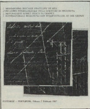
PORTOROŽ - PORTOROSE, 1987

Vstopnice v predprodaji pri prosvetnih društvih, zaostopnikih farnih mladlin, v obeh slovenskih knjigarnah, v pisarni Krščanske kulturne zveze v Celovcu (tel. št. 0 42 22/51 25 28 *23 ali *24) in eno uro pred koncertom.