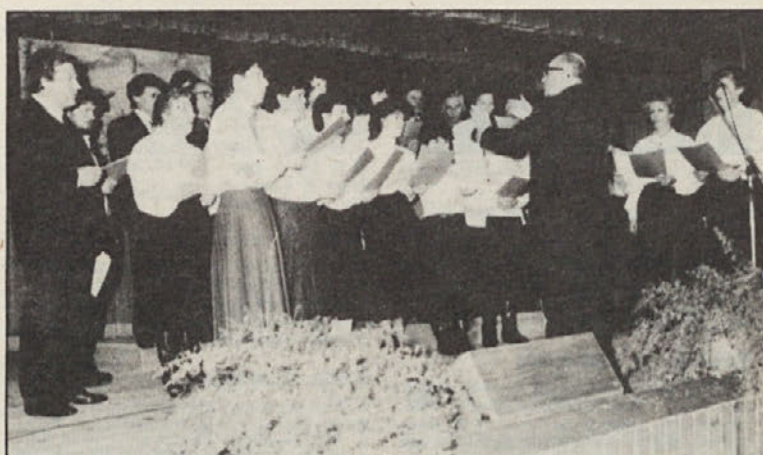
Pevski zbor „Gorotan“ poje v Šmihelu že od leta 1893.