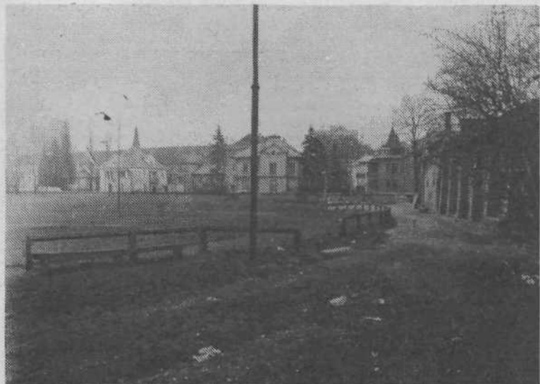
Letno telovadišče TVD Partizan Narodni dom, kjer naj bi stal nov rekreacijski center Tivoli.