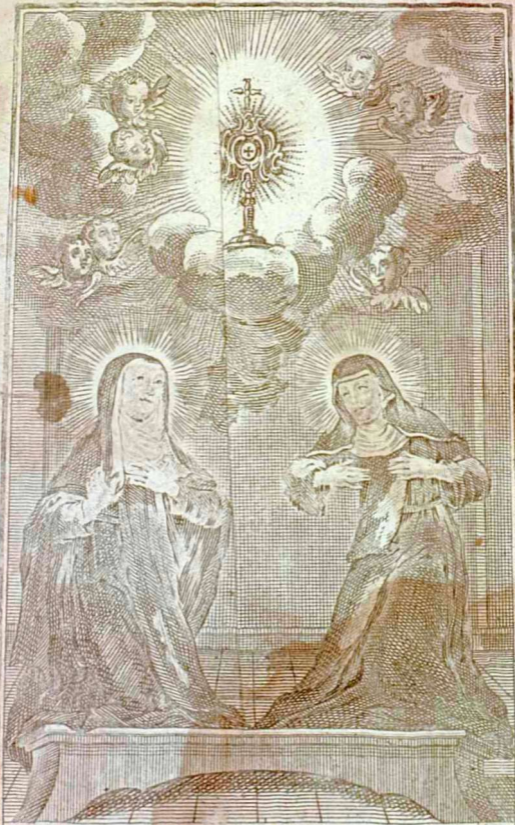
S. GERTRUDIS S. MECHTILDIS