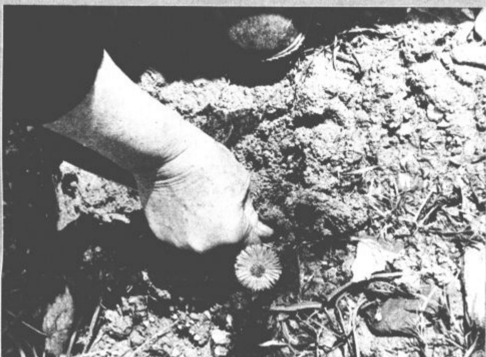
Včeraj je praznovala tudi naša vedno bolj onesnažena Zemlja. Minilo pa je tudi točno 6 let, odkar se je zgodila huda jedrska nesreča v Črnobilu, katere posledice čuti Zemlja še danes. Morda ji bomo v naslednjih letih bolj naklonjeni ...