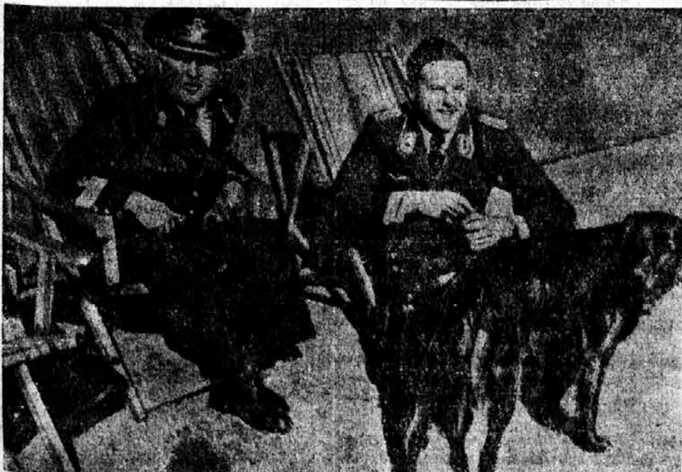
Poveljnik romunskega in nemškega letalstva v Romuniji na oddihu

bo v zvezi s prihodom madžarskih parlamentarcev v Jugoslavijo. »Popolo di Roma« piše, da »bodo ob tej priliki razčlunena vsa vprašanja, ki zanimajo obe državi v zvezi s pristopom Madžarske k trojnemu paktu. Italija in Nemčija gledata z zanimanjem na zunanjo politiko Jugoslavije.«