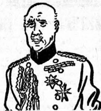
generalni guverner dominiona Kanade