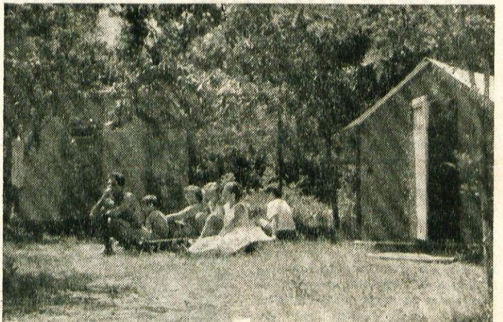
Po dobrem kosilu se prileže počitek v senci pred hišicami