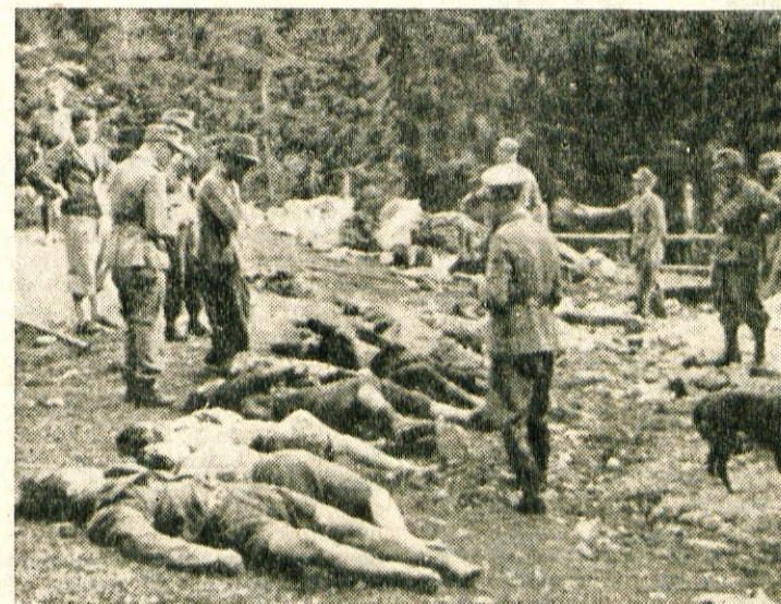
V spomin na storžiške žrtve praznujemo občinski praznik

Kot v zunanji, tako smo si tudi v znotraj države ustvarili tako politiko in stanje, kakršnega je danes lahko vesel sleherni državljan-upravljalavec. Zakaj upravljavec? Ne smemo pozabiti, da prav letos praznujemo desetletnico delavskega samoupravljanja. Pred desetimi leti so v naši državi dobili v upravljanje svoja podjetja prvi delavci. Kaj pa danes? Danes to niso več posamezni delavci, danes gre to v deset in stotisoče. Prav s temi delavskimi vojski naš narod teži k tisti Marksovi misli, ki pravi: »Tovarne v upravljanje delavcem«. Danes pa pri nas tudi to ne zadostuje več. To je prav lepo povedala tovarišica Vida Tomšičeva na ne-