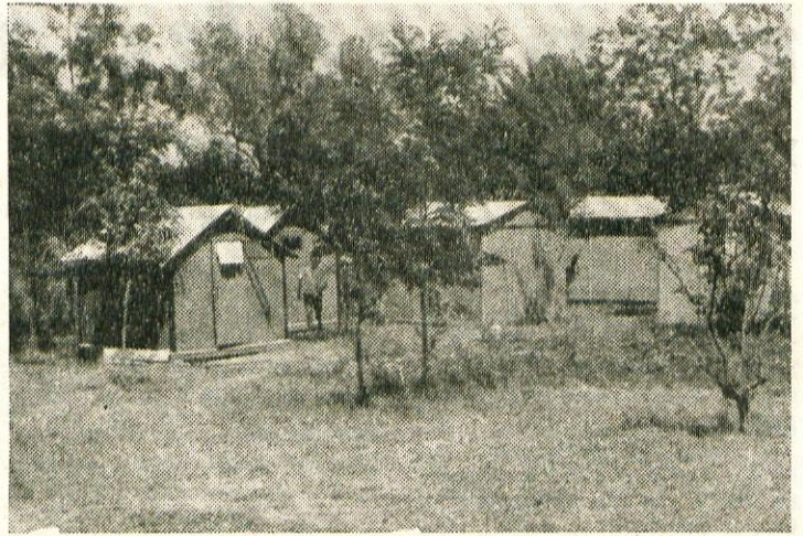
Mično naselje z majhnimi prikupnimi hišicami se vsakemu tako priljubi, da ga težko zapušča. Ob odhodu vsakdo sklene: še bom prišel!

Ker je v novih delavskih svetih, upravnih odborih in izvršnih odborih sindikalnih podružnic toliko novih članov, bo potrebno misliti na neko tako organizacijo izobraževanja, da bodo člani teh samoupravnih organov pridobili tako znanje, ki ga bodo s pridom uporabljali v praksi. Da pa bo izobraževanje res uspešno in tudi učinkovito, pa se morajo kolektivi bolj povezati z Delavsko univerzo, ki je tista ustanova, ki nudi delavcem res znanje, ki ga potrebujejo.