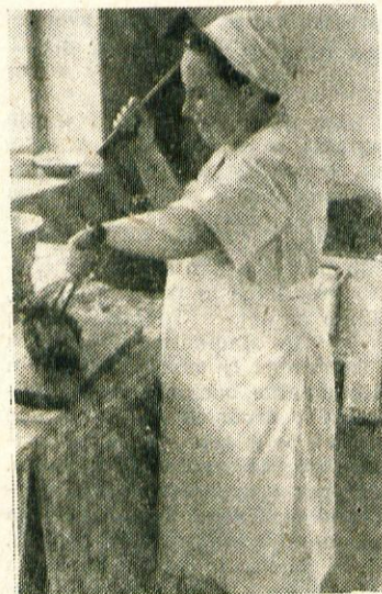
Tov. Hrastova ni bila mačehovska; pečenko nam je sekala kar s sekiro

Sicer pa sindikati zastopamo mnenje naj bi dali regres vsakemu delavcu, ne glede kje letuje. Samo tako bi res še bolj pospešili delavski turizem in omogočili vsem delavcem cenena letovanja tako, da bi po dopustu še z večjim poletom prišli za delo in ustvarjali skupnosti in sebi lepše življenje.«