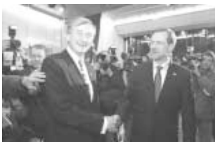
Peterle in Türk si podajata roke. Bo prijaznost ostala v drugem krogu?

Peterle je dejal, da si za protikandidata v drugem krogu želi „tistega, ki ga bodo izbrali ljudje“. Zavrnil je kritike, da so bila njegova stališča premeška. „Jaz sem bil jasen v mojih