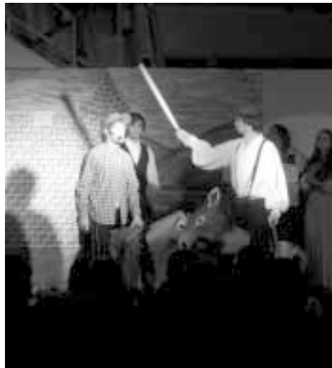
Dvoboj med Brdavsom in Krpanom, kot so si ga zamislili mladi na Pristavi