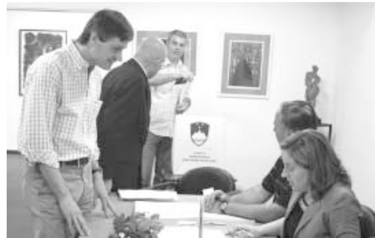
Med volitvami na veleposlaništvu RS v Buenos Airesu

Poleg tega so prejeli na veleposlaništvu nad 200 glasovnic po pošti, ki jih bodo poslali v Ljubljano, da jih tam preštejejo. Verjetno bodo rezultati podobni.